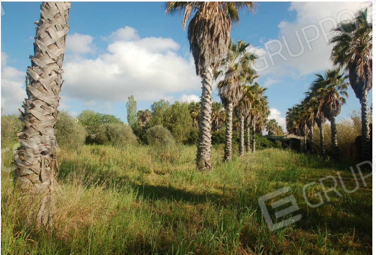
VISTA 53: Mappale 939 (ex 285) - Vista 4