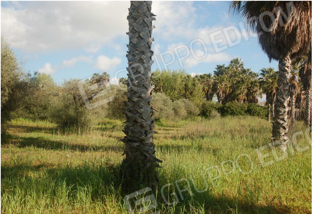
VISTA 56: Mappale 289 - Vista 1