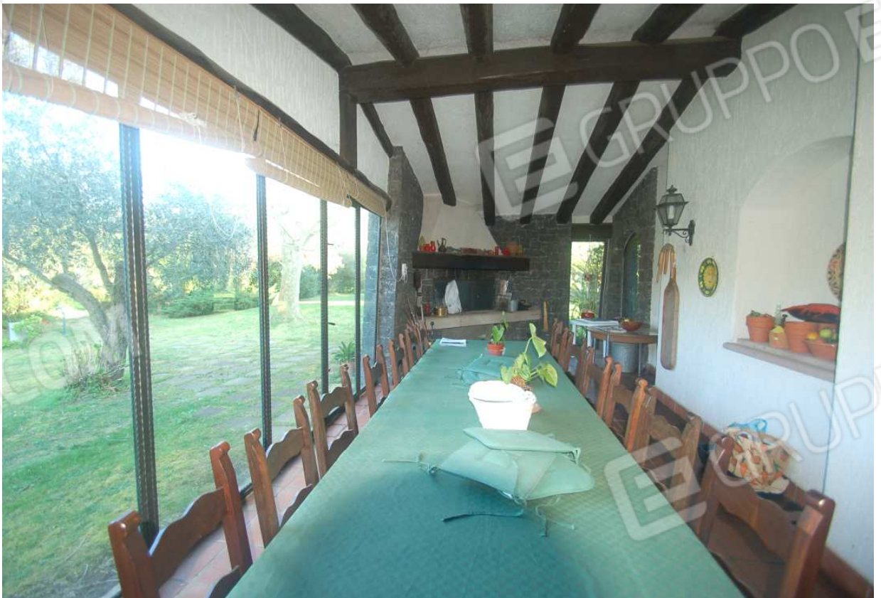
VISTA 47: Piano Terra – Veranda