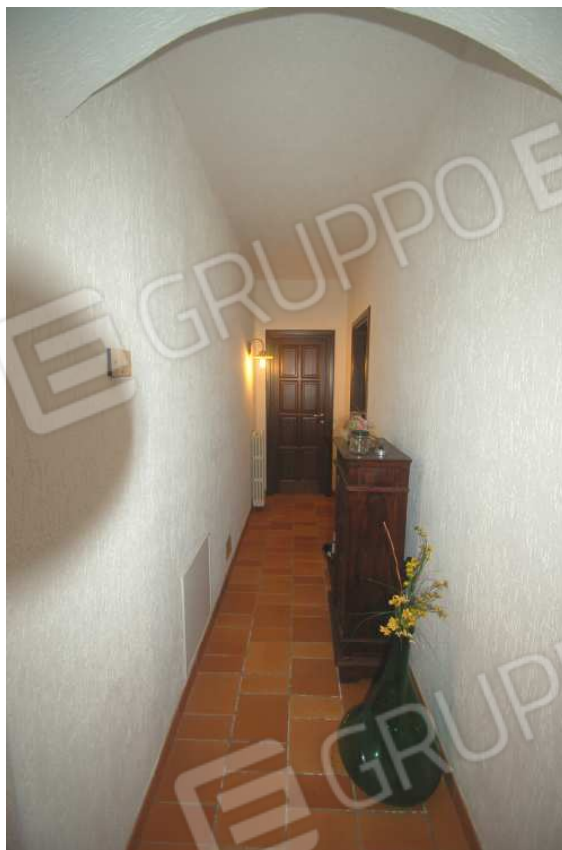
VISTA 27: Piano Scantinato – Disimpegno