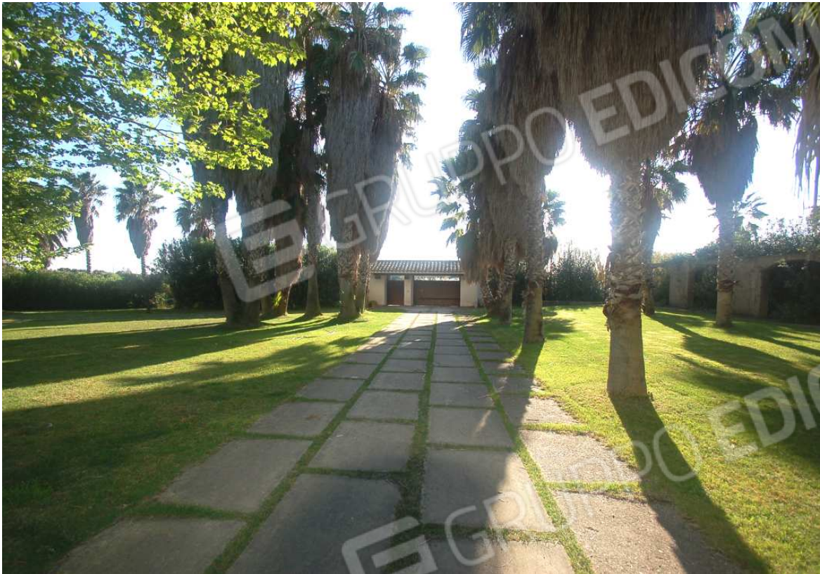
VISTA 5: Vialeto d'ingresso - Vista accesso mappale 288, sub.1