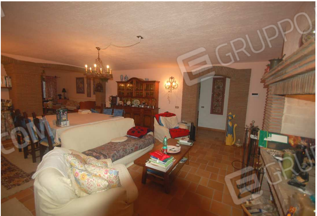
VISTA 24: Piano Scantinato – Soggiorno/Cantina - Vista 2