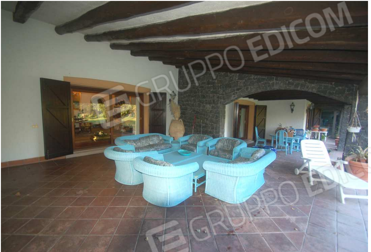
VISTA 46: Piano Terra – Portico/Veranda posteriore