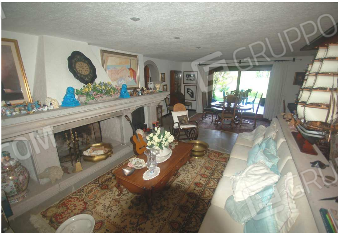
VISTA 32: Piano Terra – Soggiorno - Vista 3