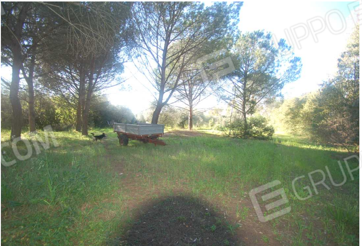
VISTA 55: Mappale 287 - Vista 2