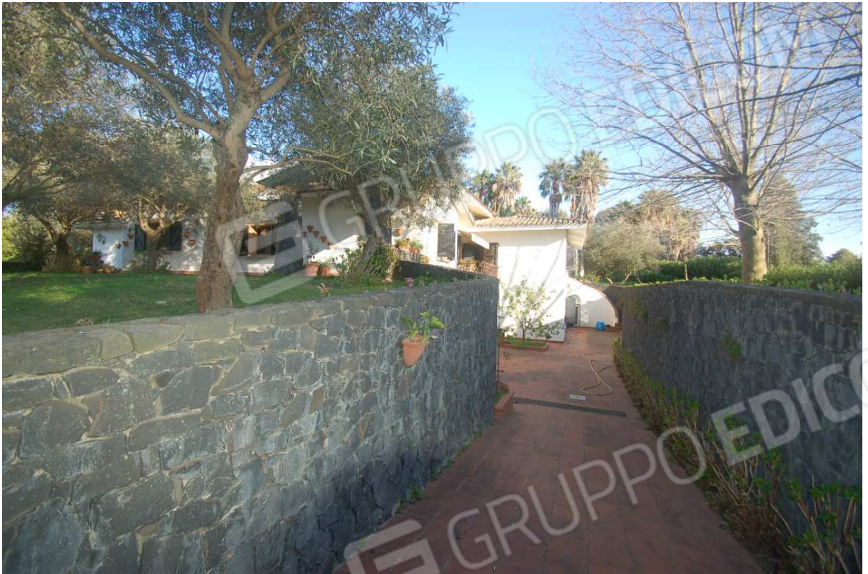
VISTA 15: Rampa accesso scantinato - Lato Nord-Ovest