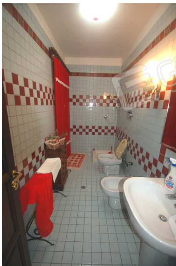
VISTA 28: Piano Scantinato – Bagno