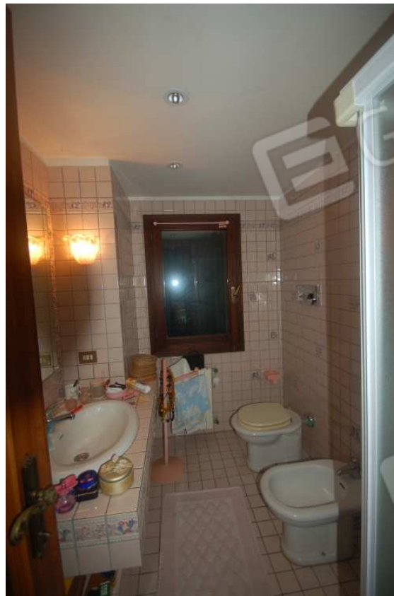
VISTA 45: Piano Primo – Bagno 2