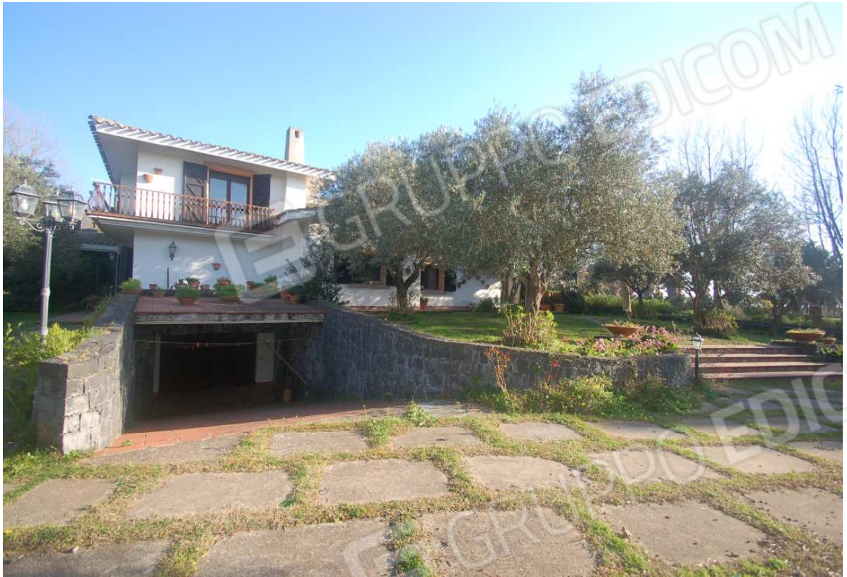
VISTA 7: Prospetto anteriore ingresso abitazione - Vista 2