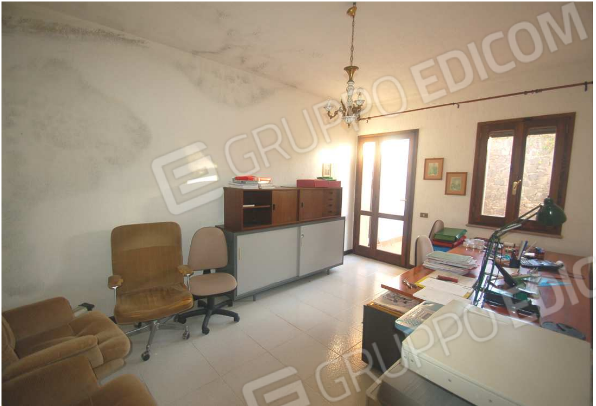
VISTA 19: Piano Scantinato – Studio/Ufficio - Vista 1