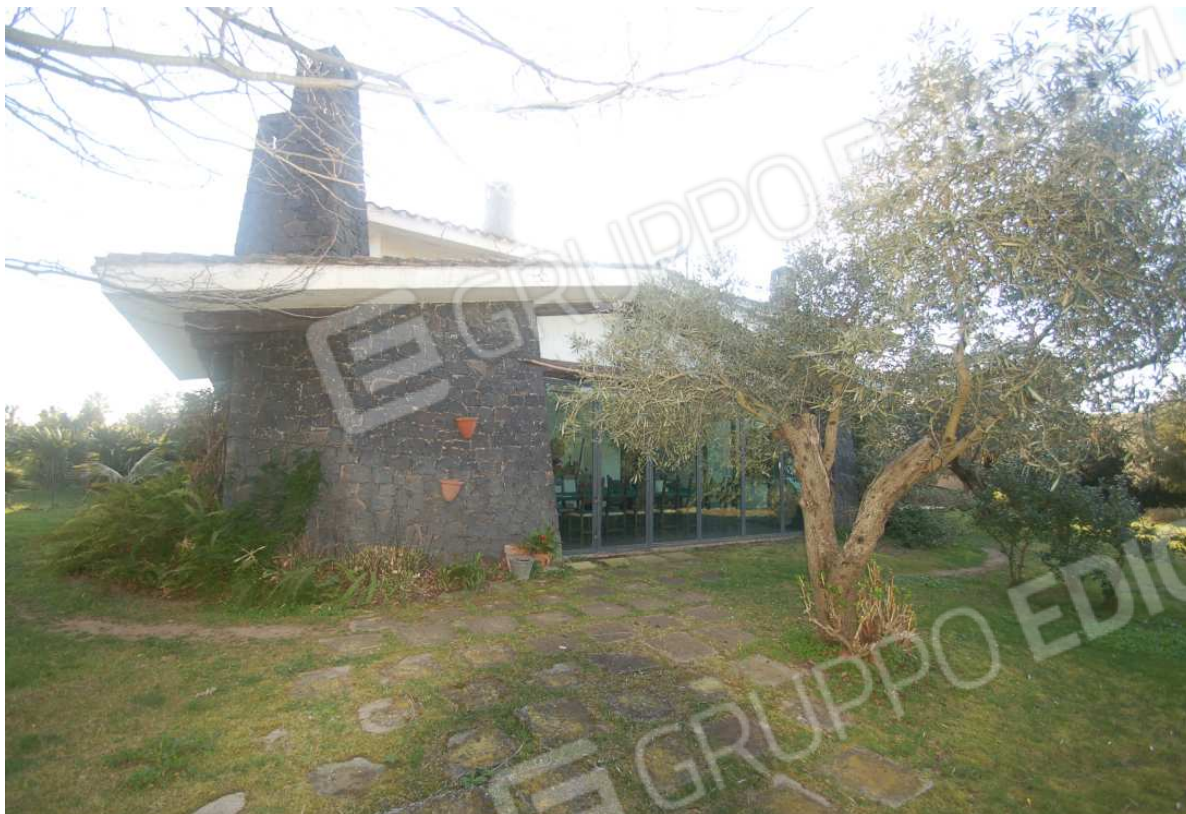
VISTA 9: Veranda laterale - Lato Nord-Est