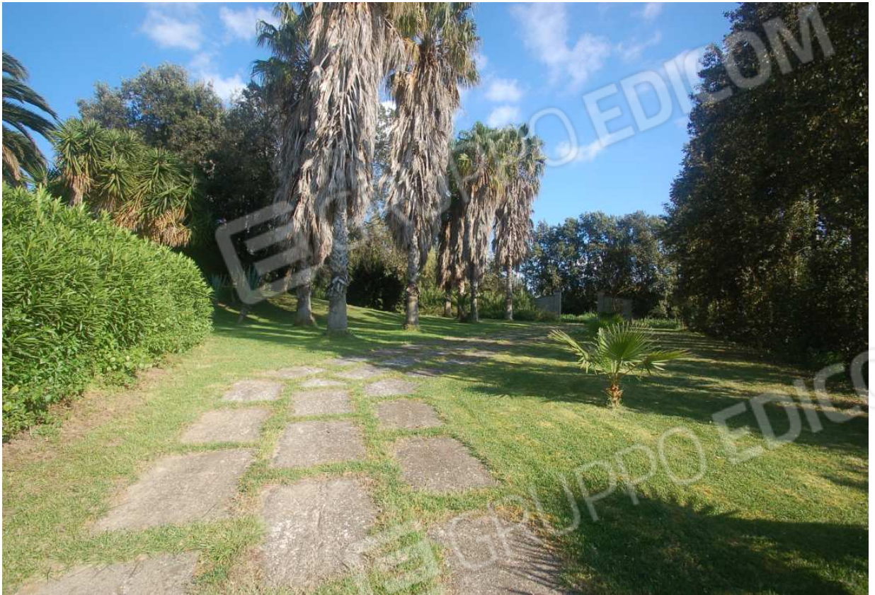
VISTA 48: MAPPALÉ 288, SUB. 1 - VISTA 1