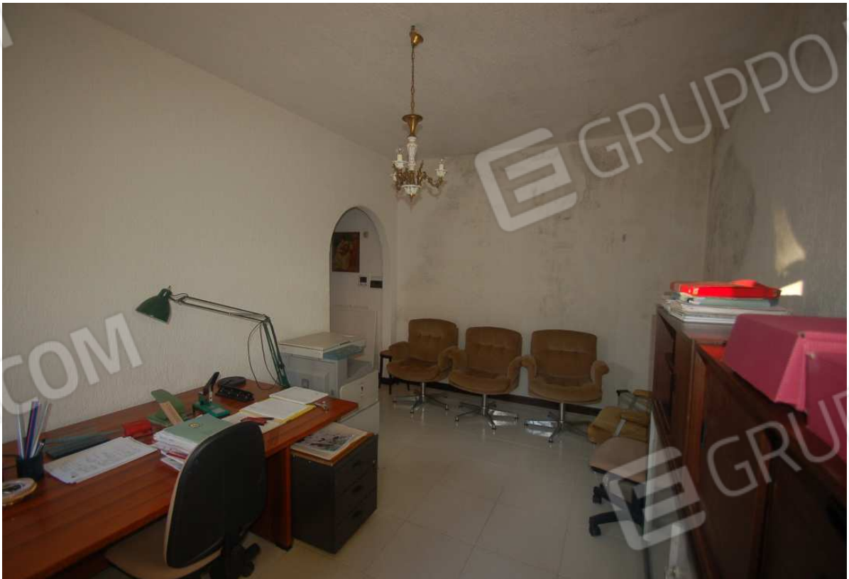
VISTA 20: Piano Scantinato – Studio/Ufficio - Vista 2