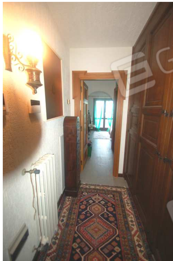
VISTA 41: Piano Primo – Disimpegno