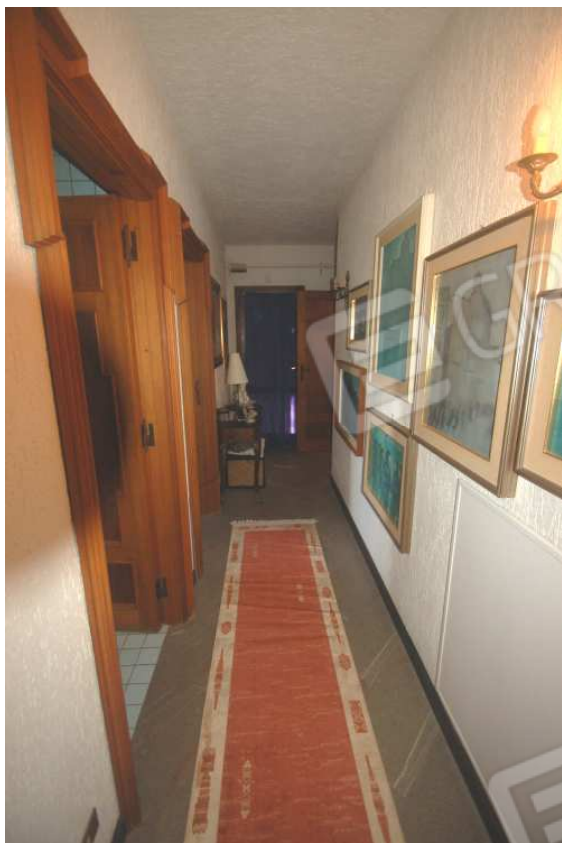
VISTA 35: Piano Terra – Disimpegno