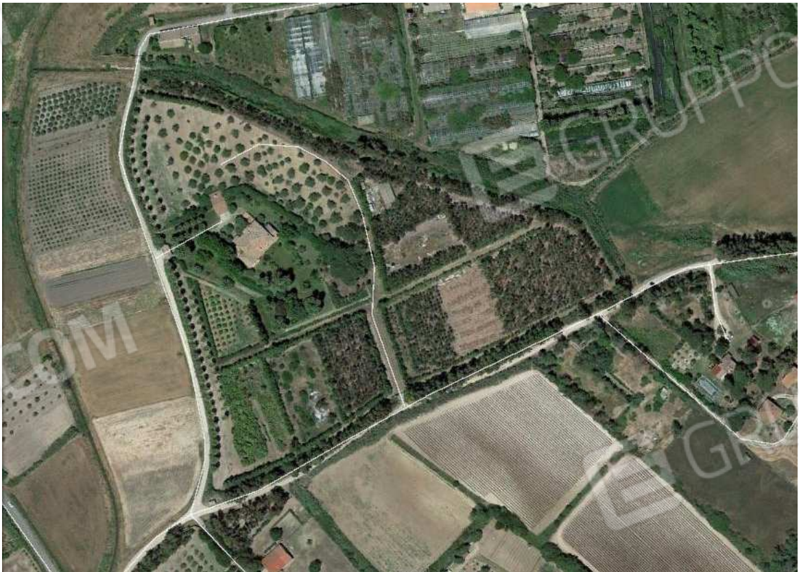
VISTA 2: Individuazione del fabbricato e dei terreni - Loc. Su Mattoni snc (vista aerea)