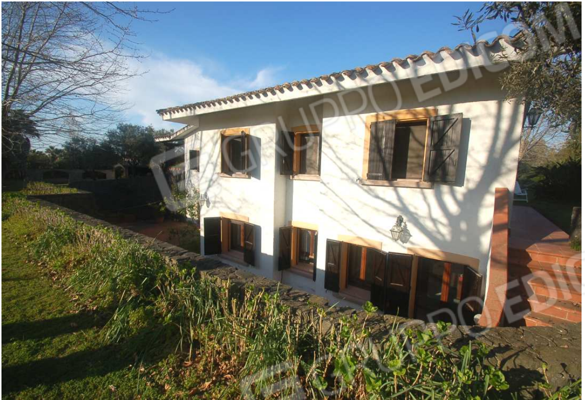
VISTA 13: Prospetto Laterale - Lato Sud-Ovest - Vista 1