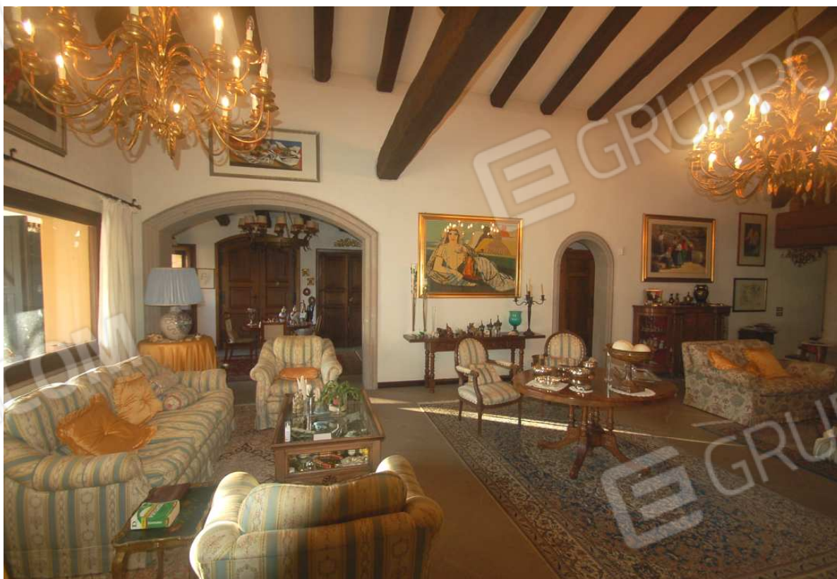
VISTA 30: Piano Terra – Soggiorno - Vista 1