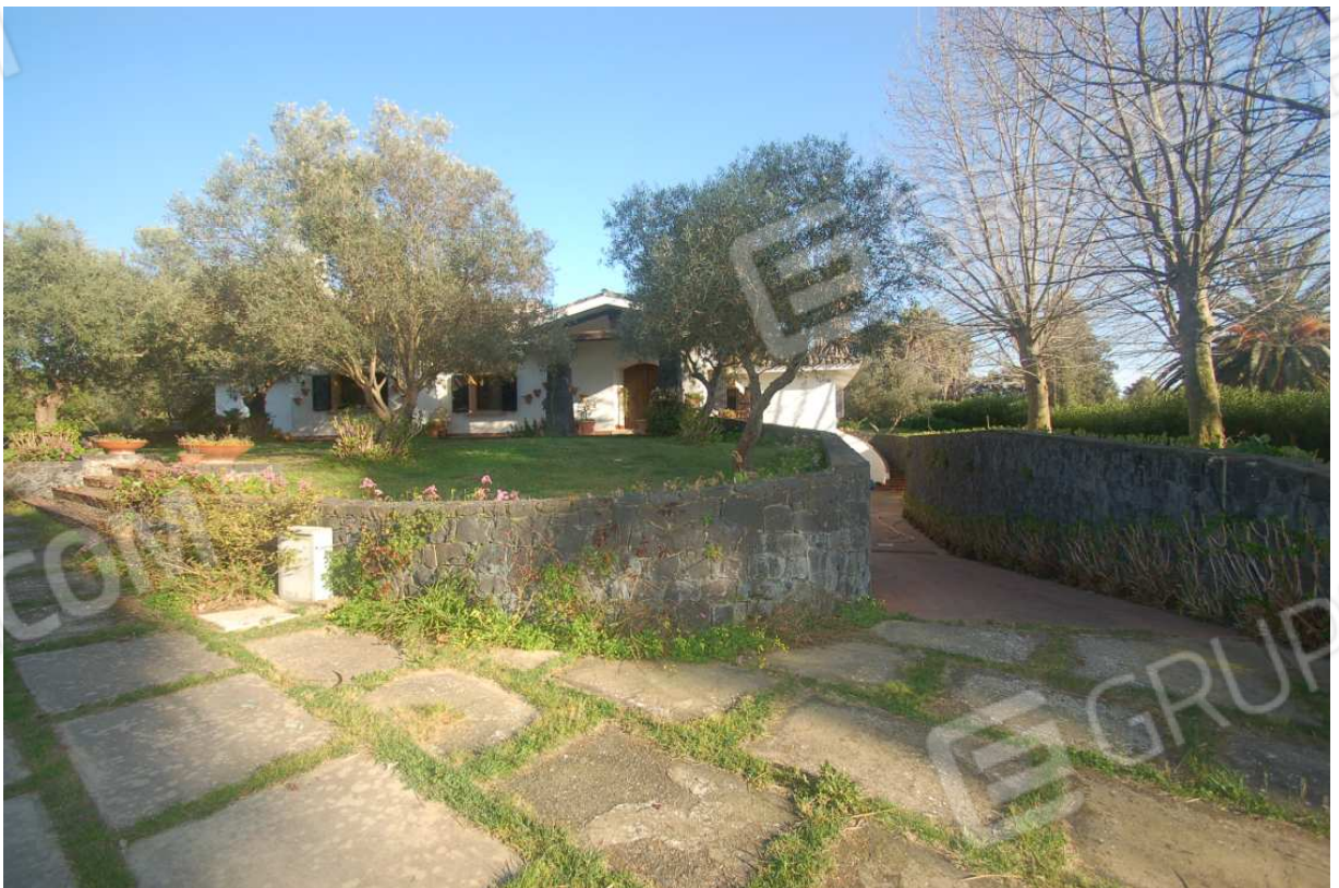
VISTA 16: Scorcio fabbricato e rampa accesso scantinato - Lato Nord-Ovest