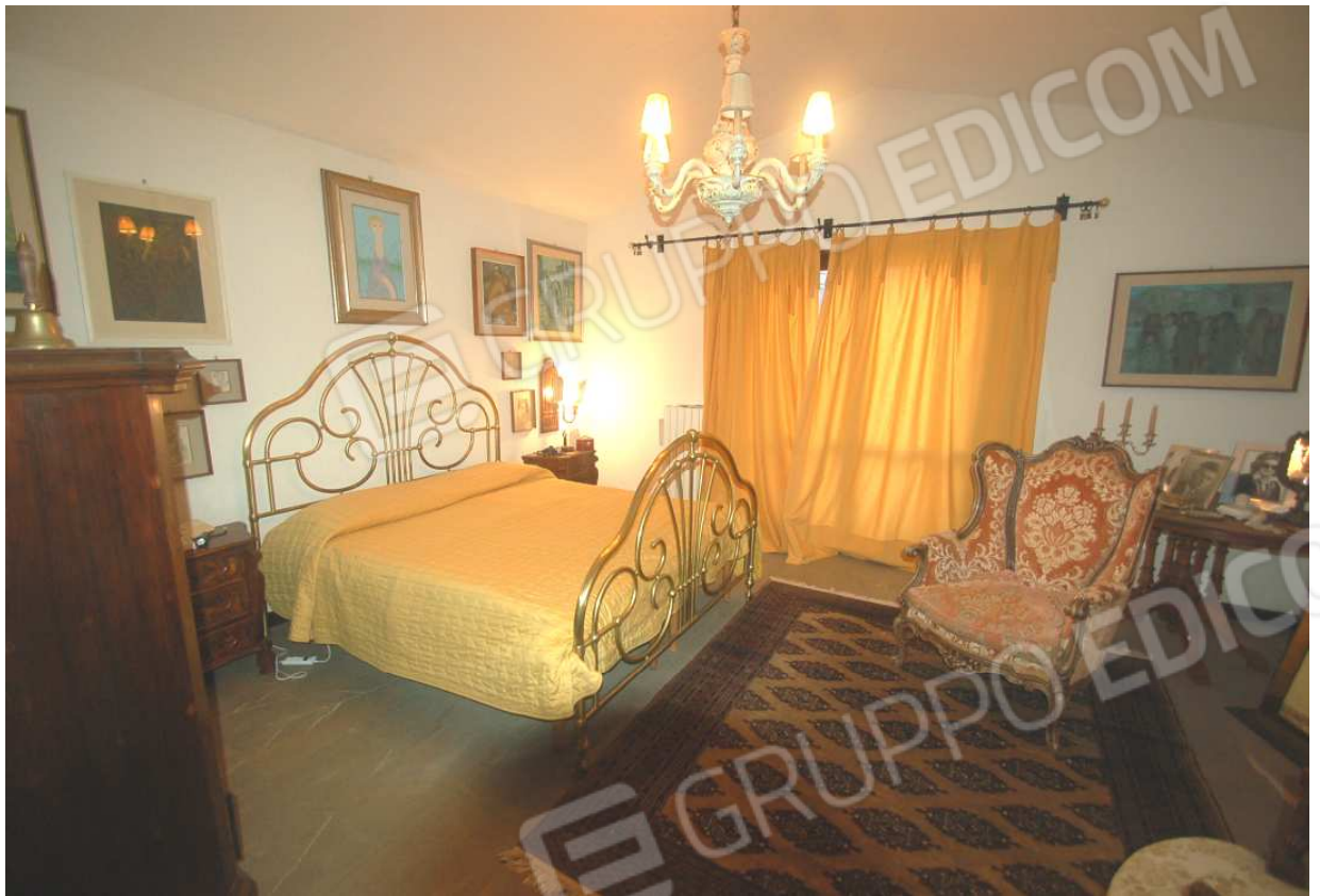
VISTA 42: Piano Primo – Camera 1