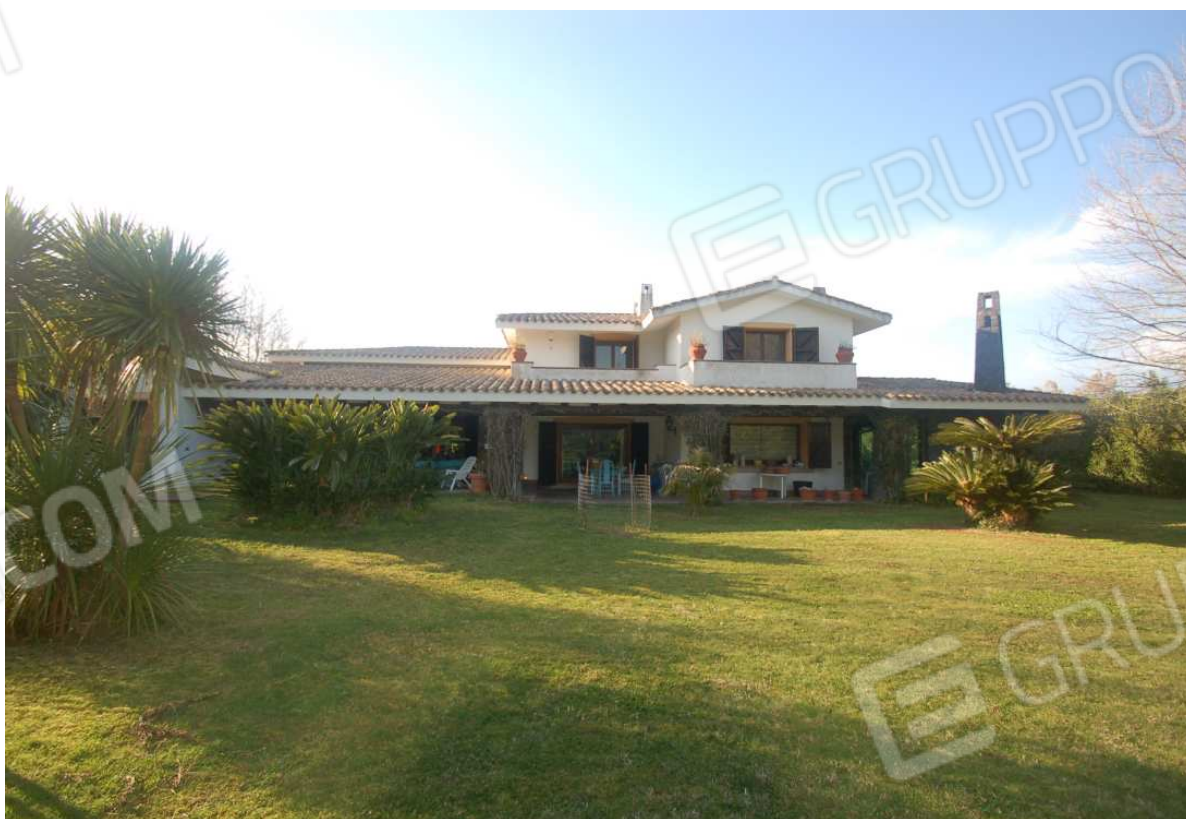
VISTA 10: Prospetto Posteriore - Lato Sud-Est - Vista 1