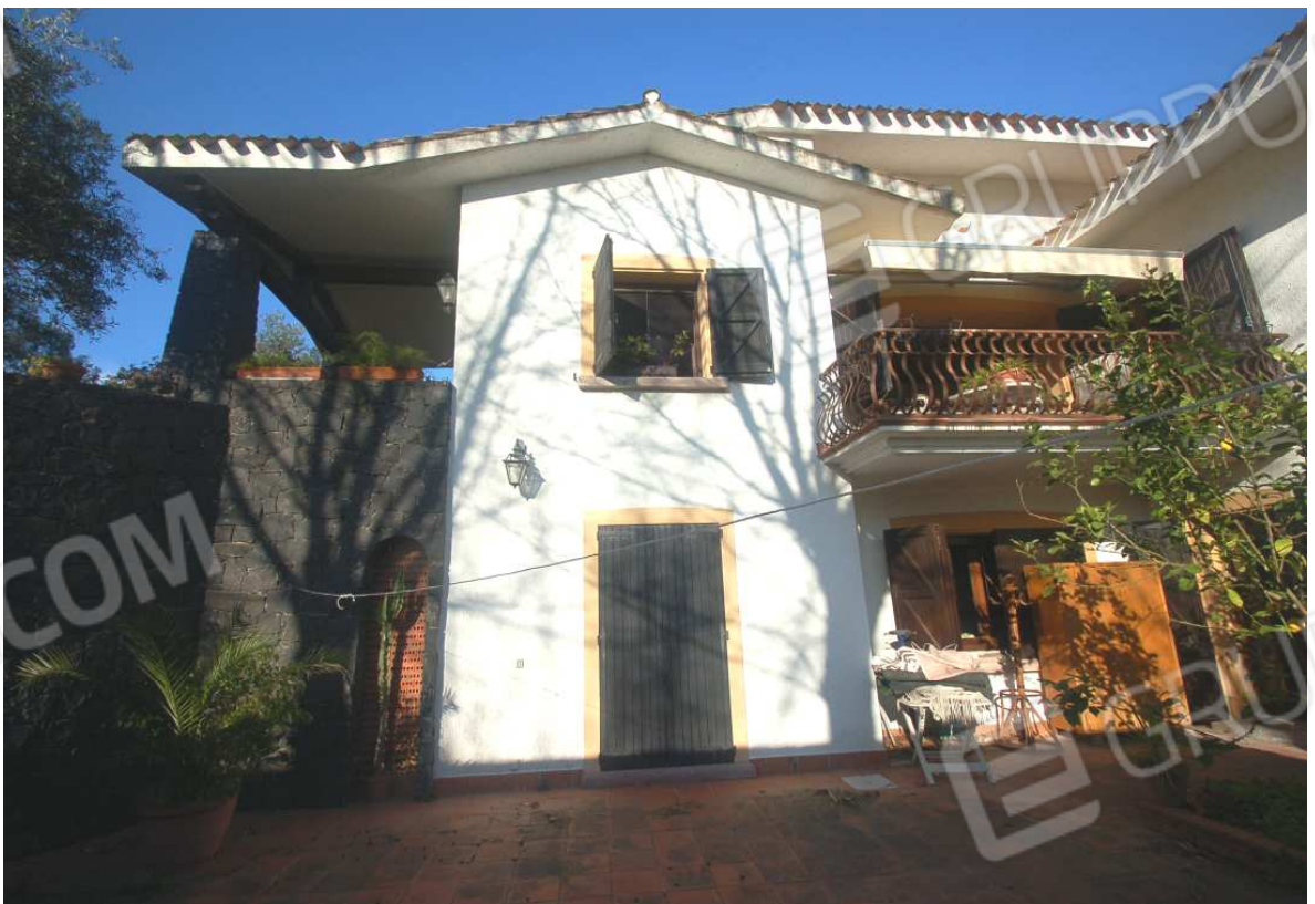
VISTA 14: Prospetto Laterale - Lato Sud-Ovest - Vista 2