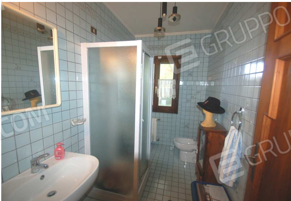
VISTA 37: Piano Terra – Bagno 2