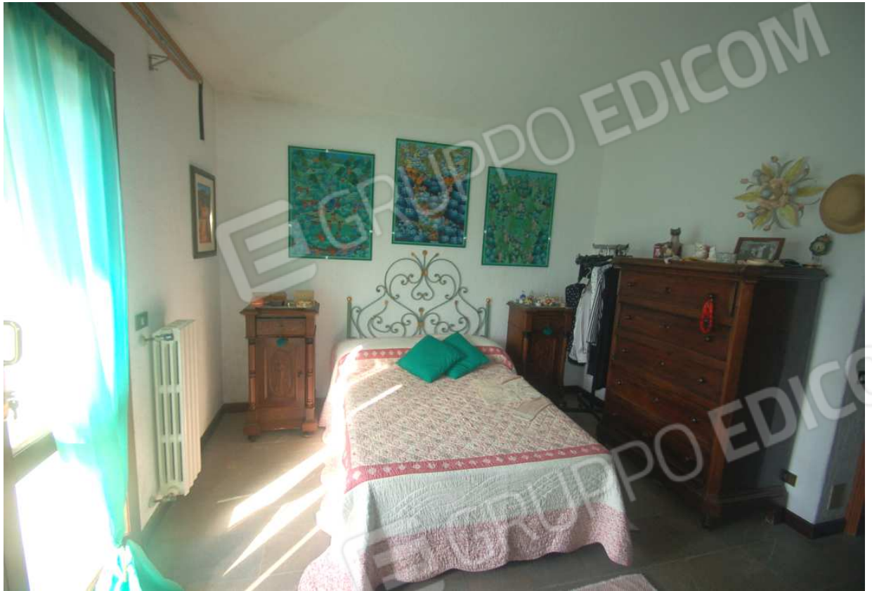
VISTA 44: Piano Primo – Camera 2