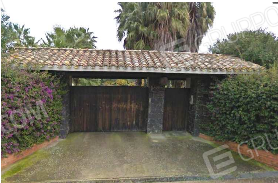
VISTA 4: Ingresso principale all'abitazione Mappale 288, sub.1