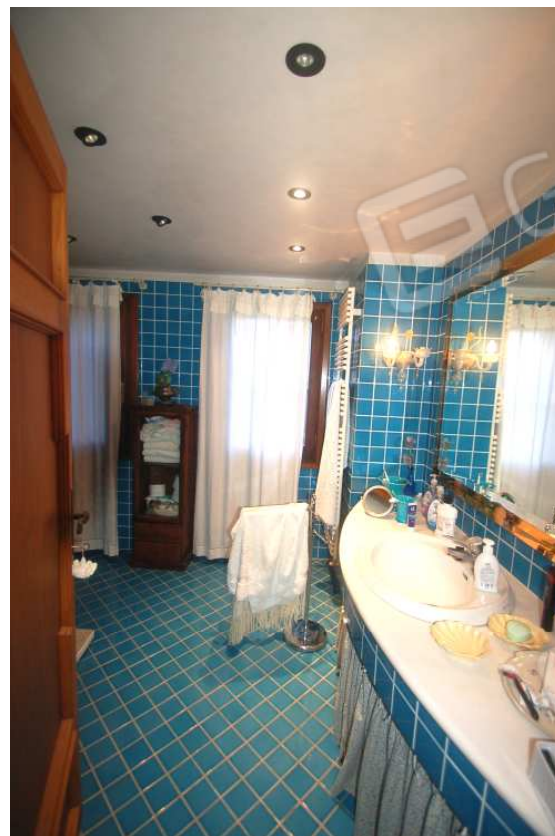
VISTA 43: Piano Primo – Bagno 1