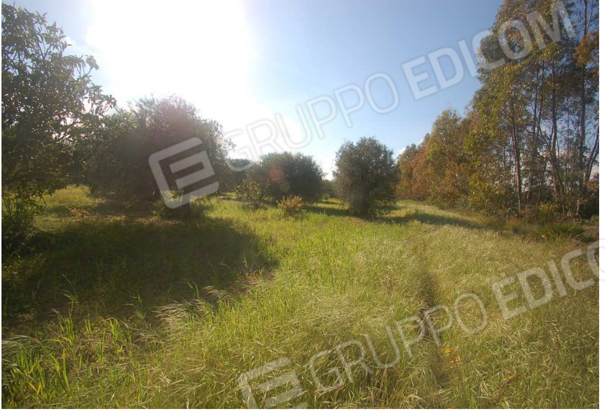
VISTA 50: Mappale 939 (ex 285) - Vista 1