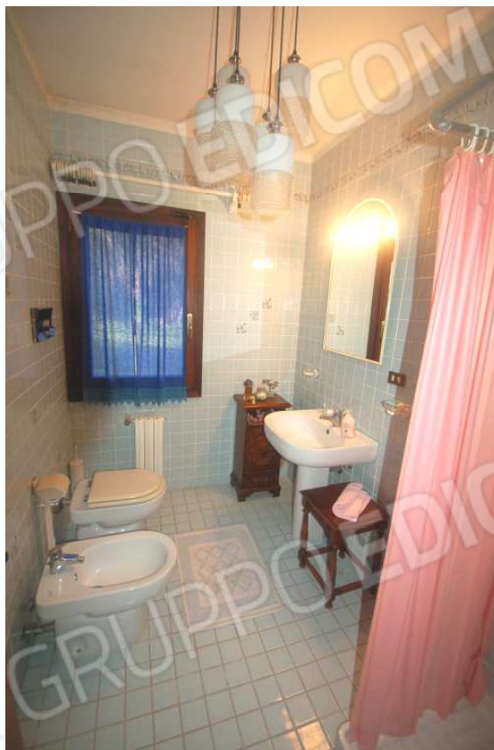
VISTA 36: Piano Terra – Bagno 1