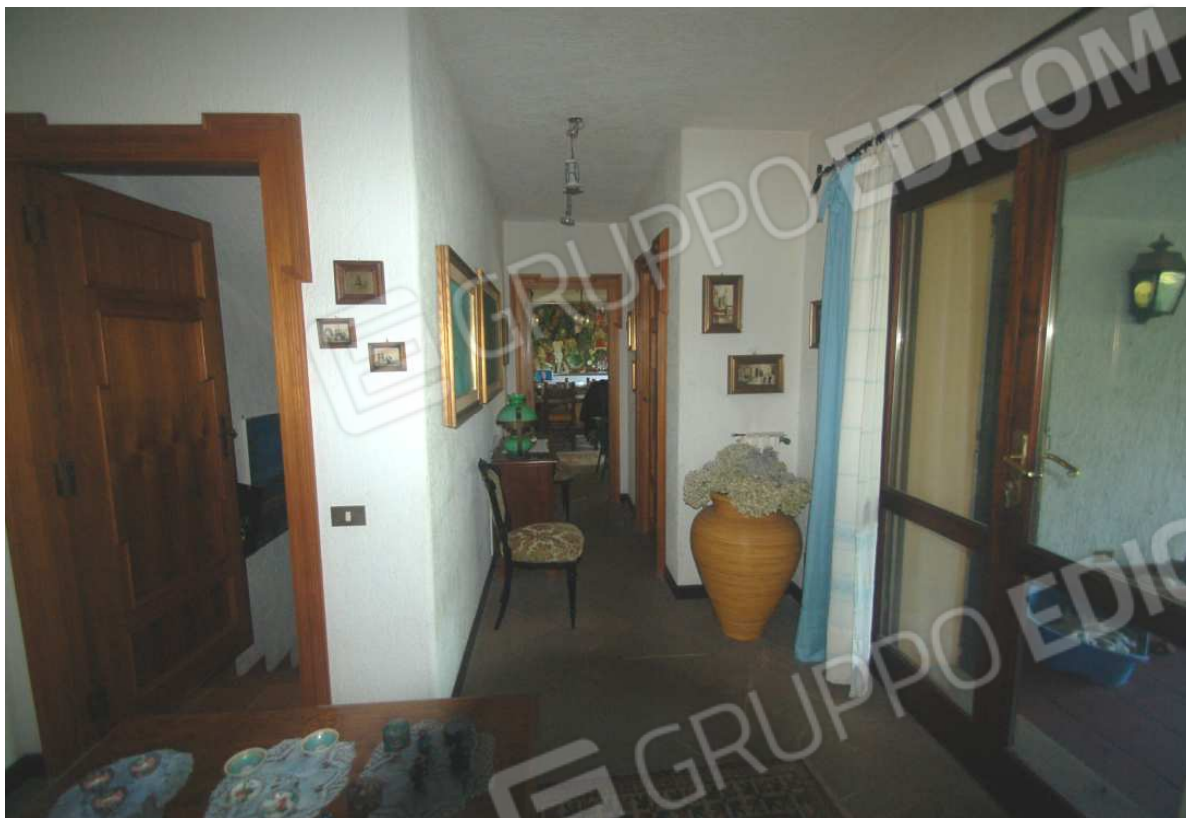
VISTA 33: Piano Terra – Disimpegno