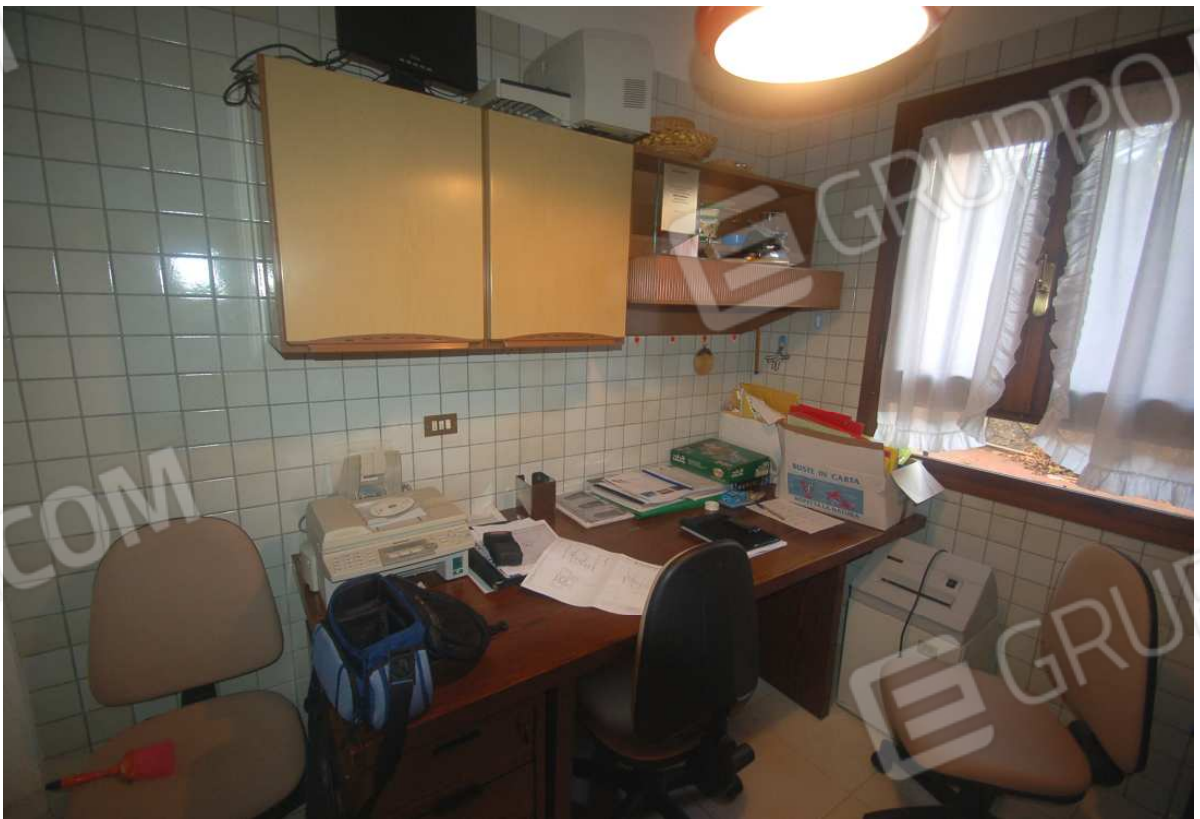
VISTA 22: Piano Scantinato – Disimpegno/Ufficio - Vista 4