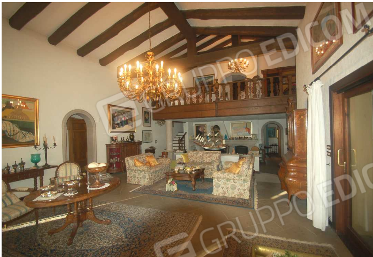
VISTA 31: Piano Terra – Soggiorno - Vista 2