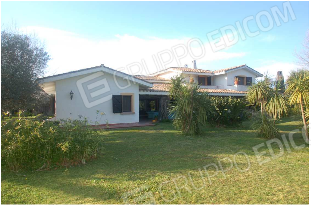
VISTA 11: Prospetto Posteriore - Lato Sud-Est - Vista 2