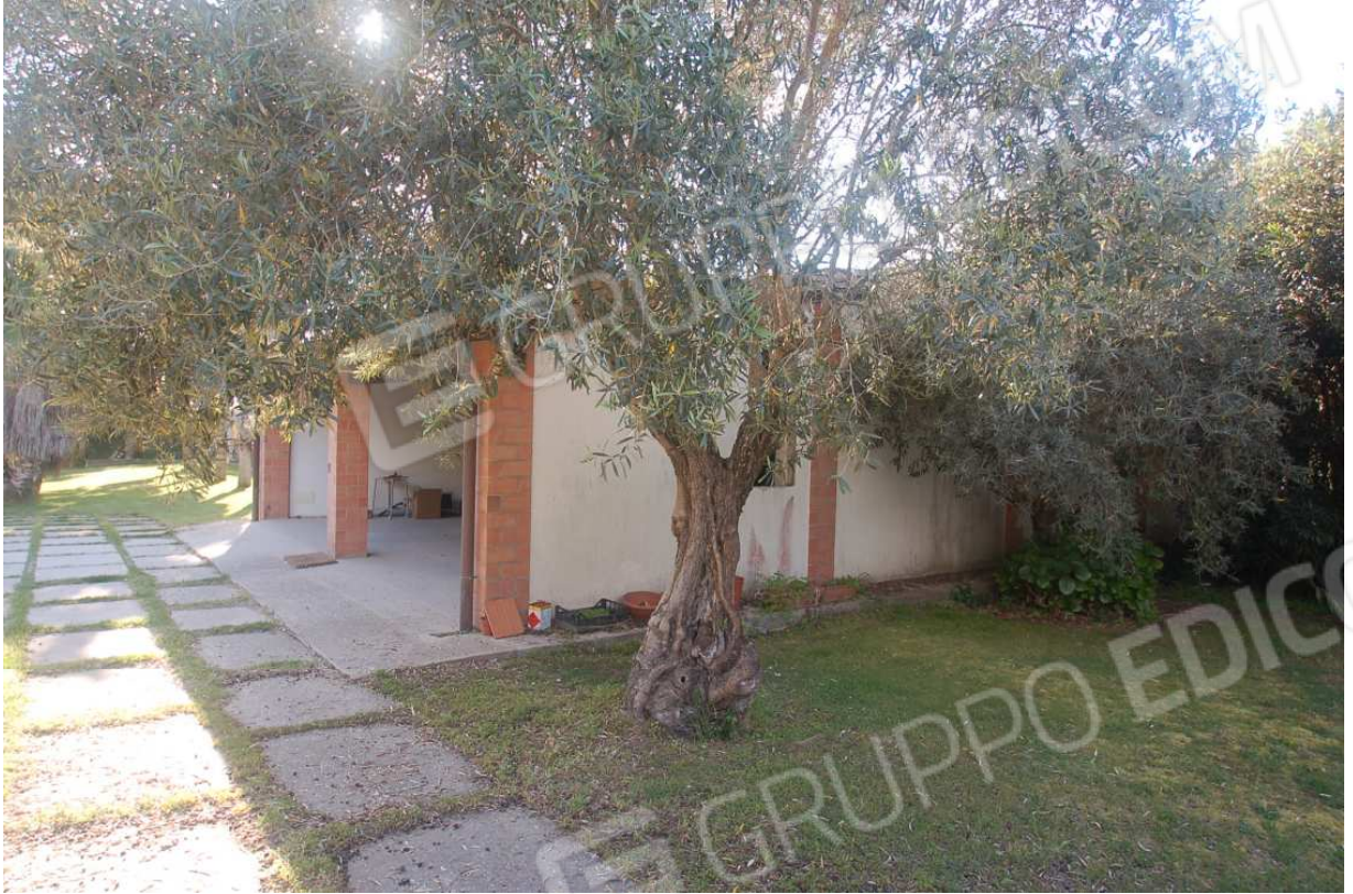
VISTA 17: Locale Deposito - Vista esterna