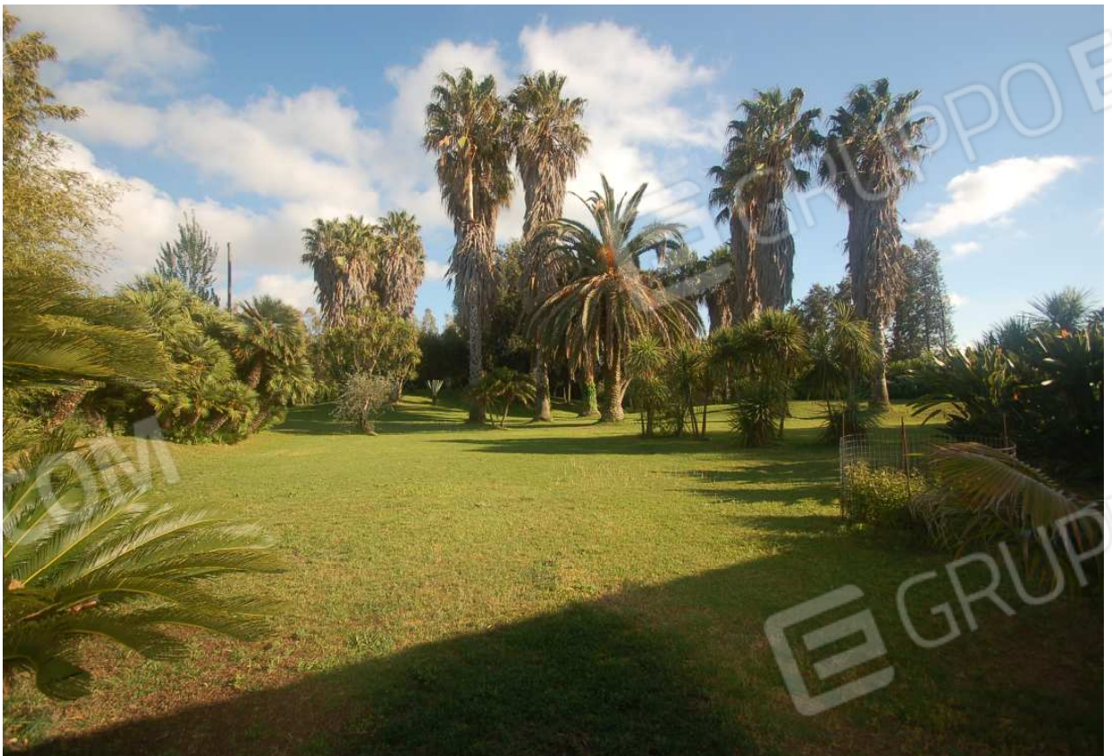
VISTA 49: Mappalé 288, sub.1 - Vista 2