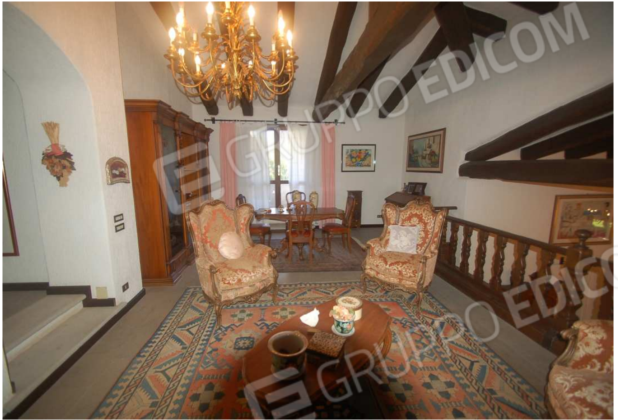
VISTA 40: Piano Primo – Soppalco