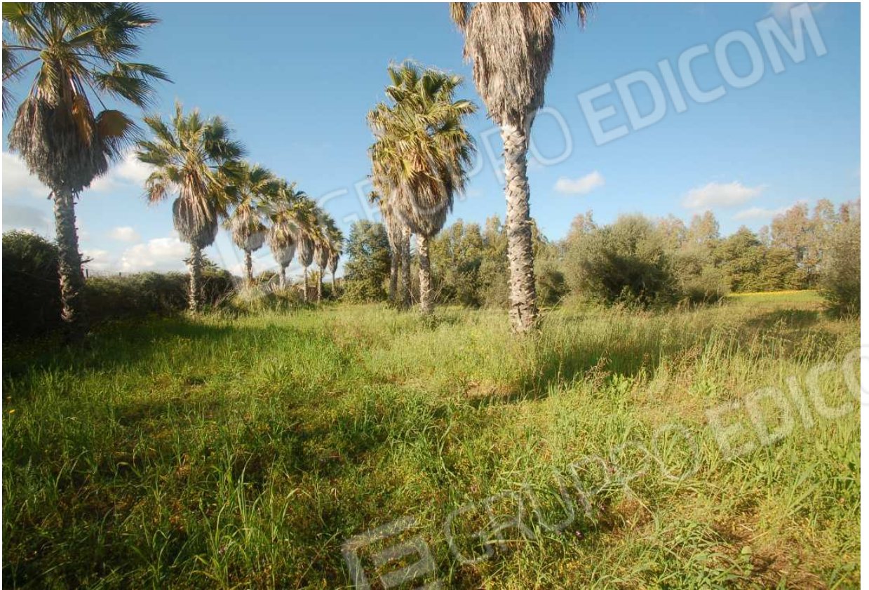
VISTA 52: Mappale 939 (ex 285) - Vista 3