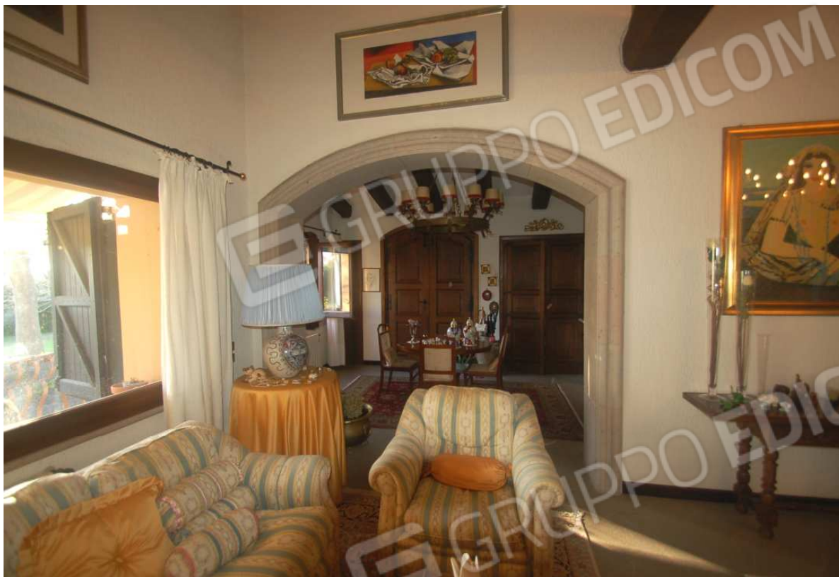
VISTA 29: Piano Terra – Ingresso