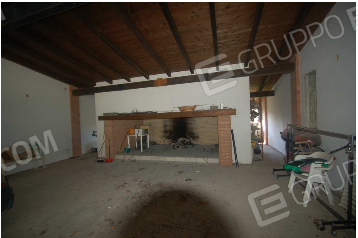
VISTA 18: Locale Deposito - Vista interna