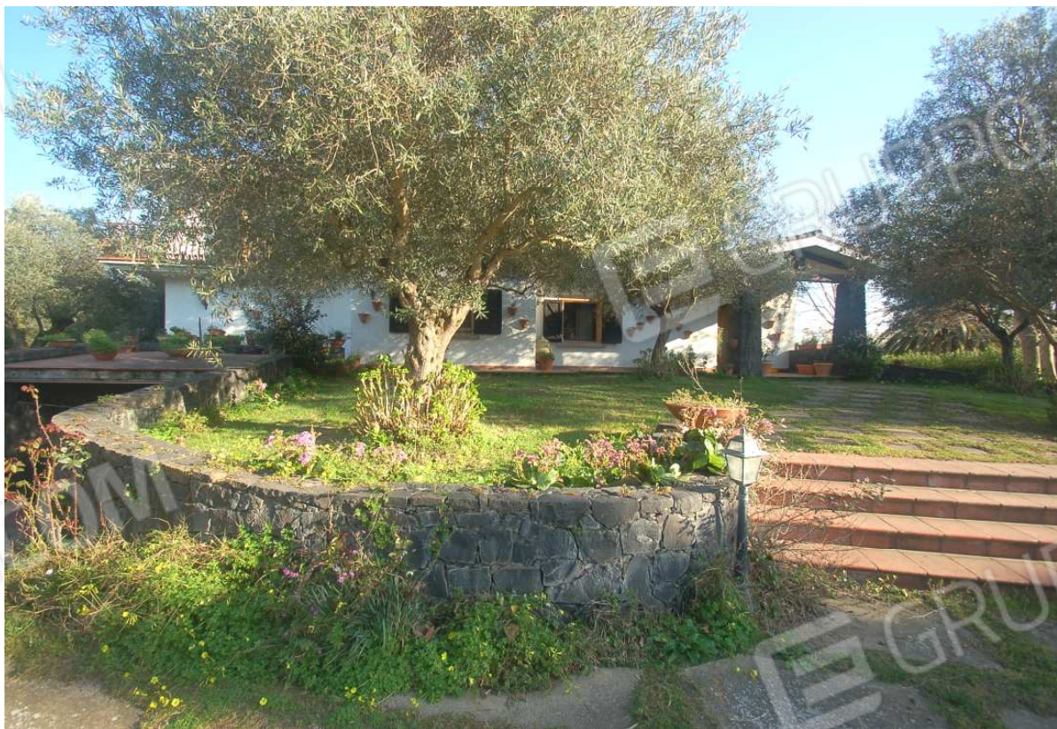
VISTA 6: Prospetto anteriore ingresso abitazione - Vista 1