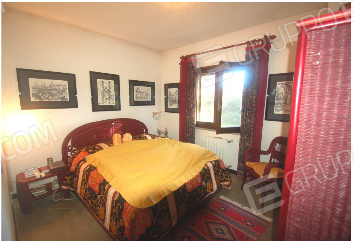
VISTA 39: Piano Terra – Camera 2