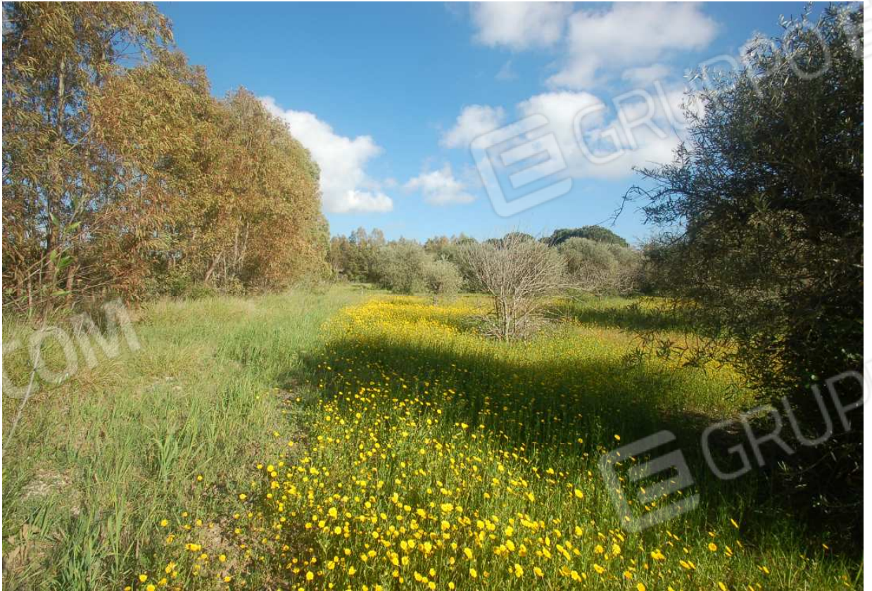
VISTA 51: Mappale 939 (ex 285) - Vista 2