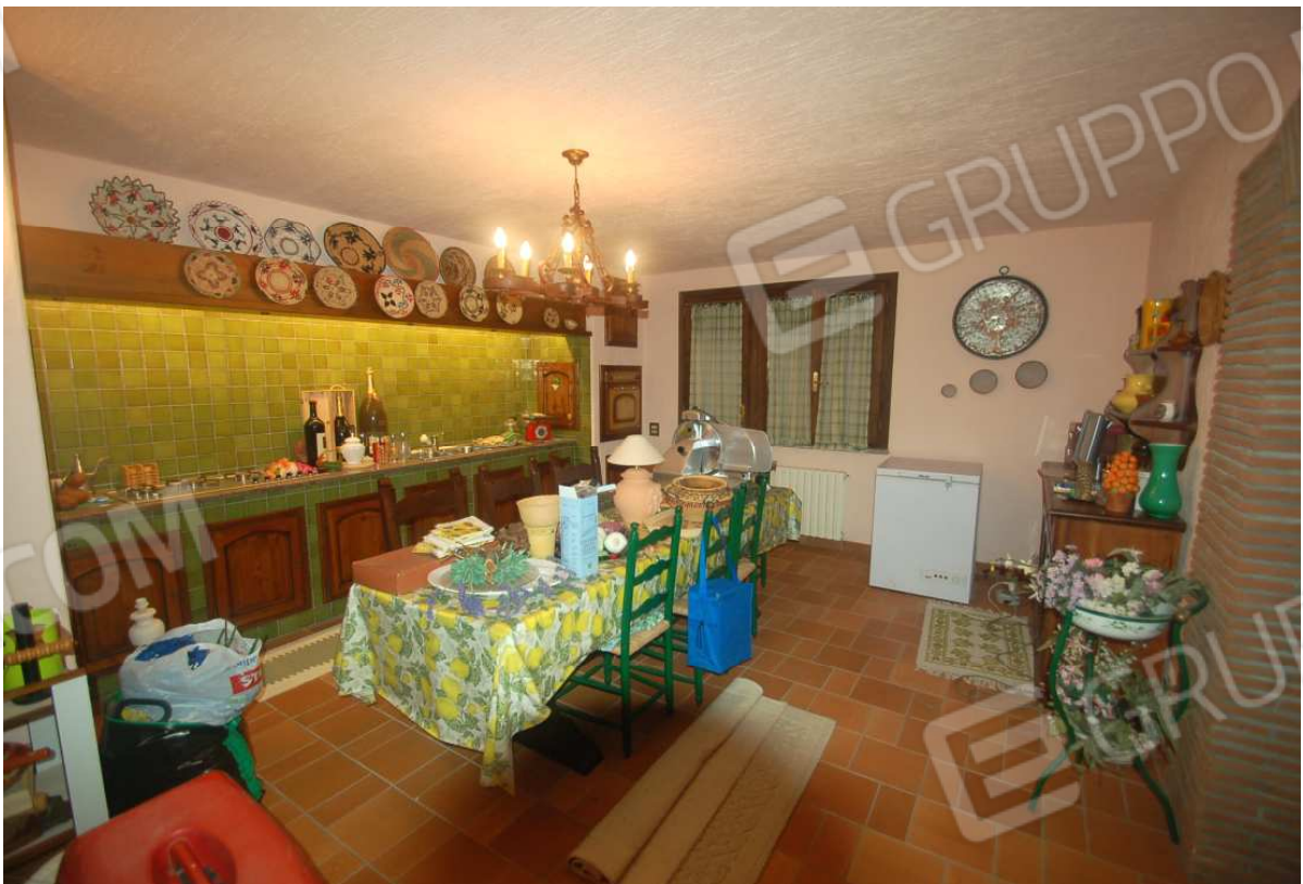
VISTA 26: Piano Scantinato – Cucina Rustica/Taverna