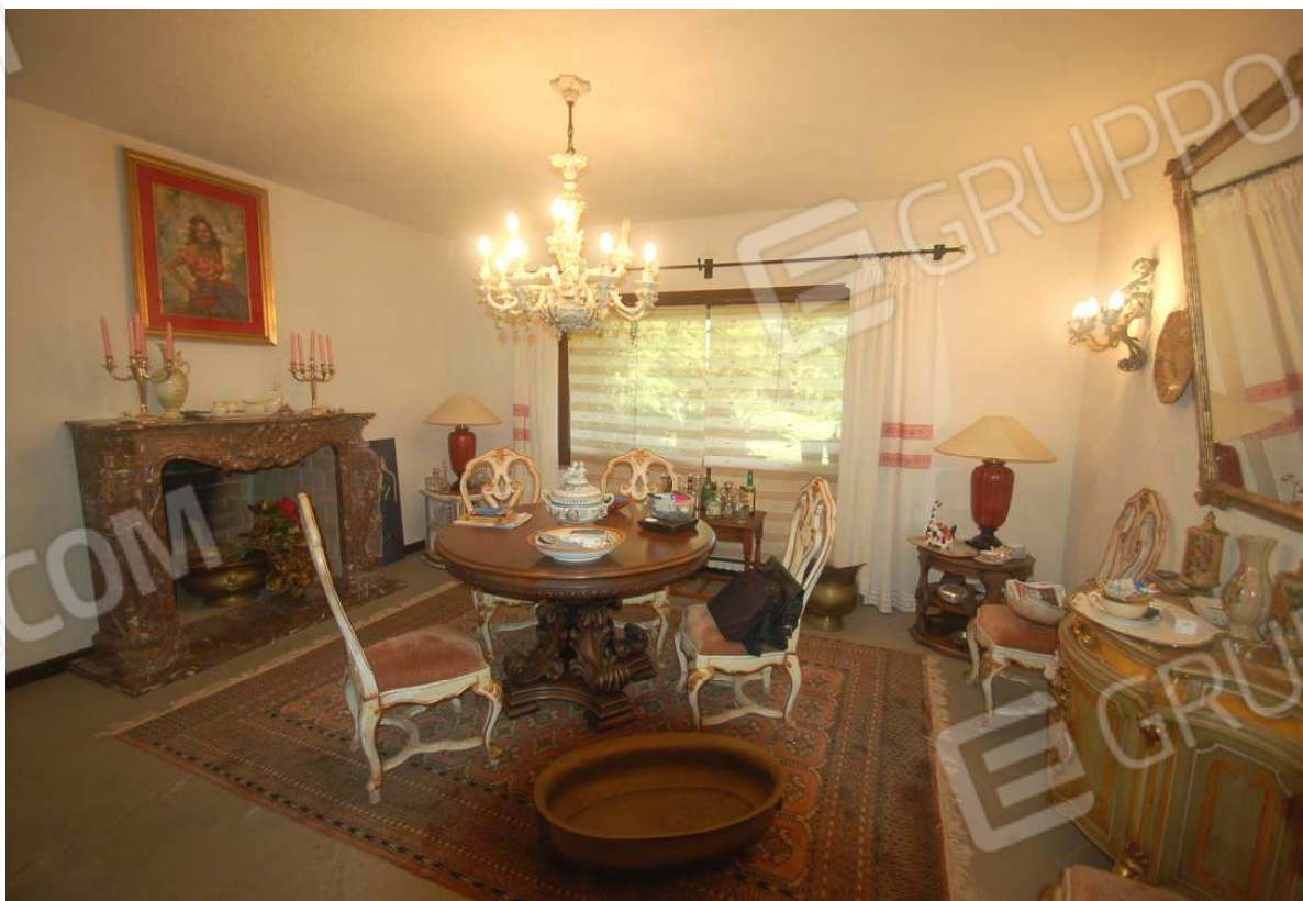
VISTA 34: Piano Terra – Pranzo