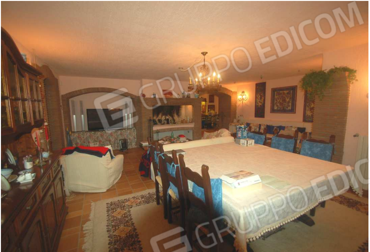
VISTA 23: Piano Scantinato – Soggiorno/Cantina - Vista 1