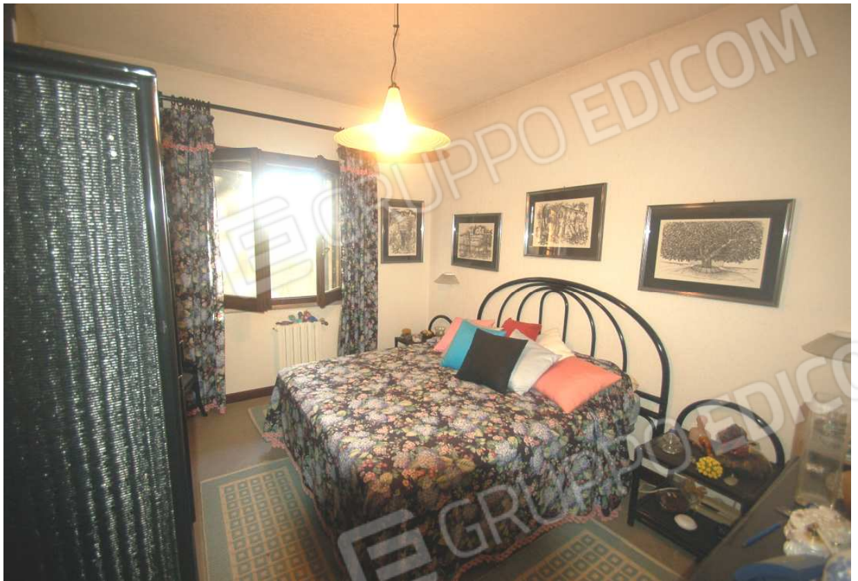
VISTA 38: Piano Terra – Camera 1