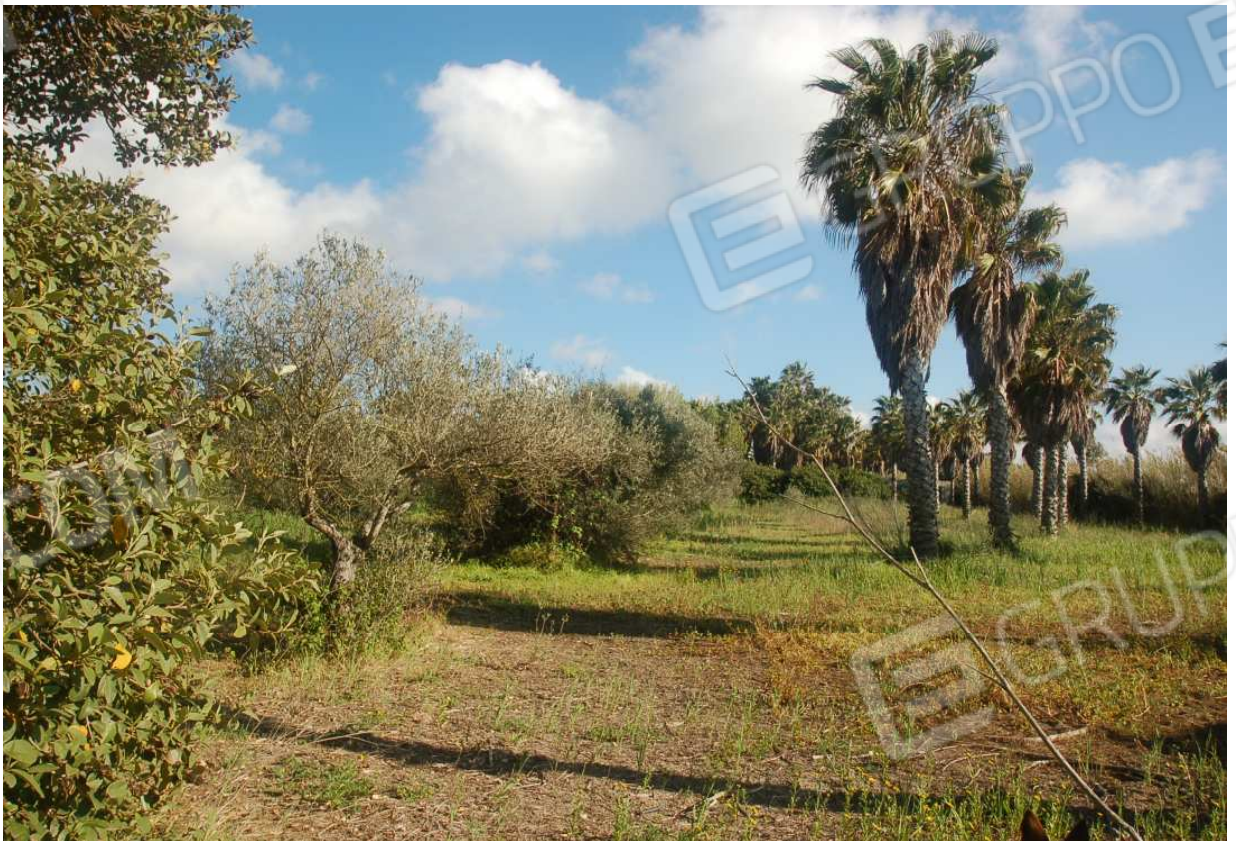
VISTA 57: Mappale 289 - Vista 2