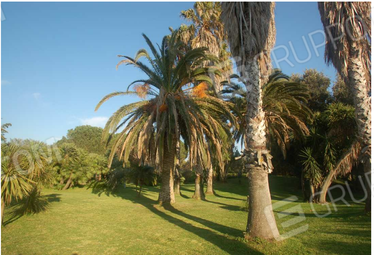
VISTA 12: Giardino Posteriore - Lato Sud-Est