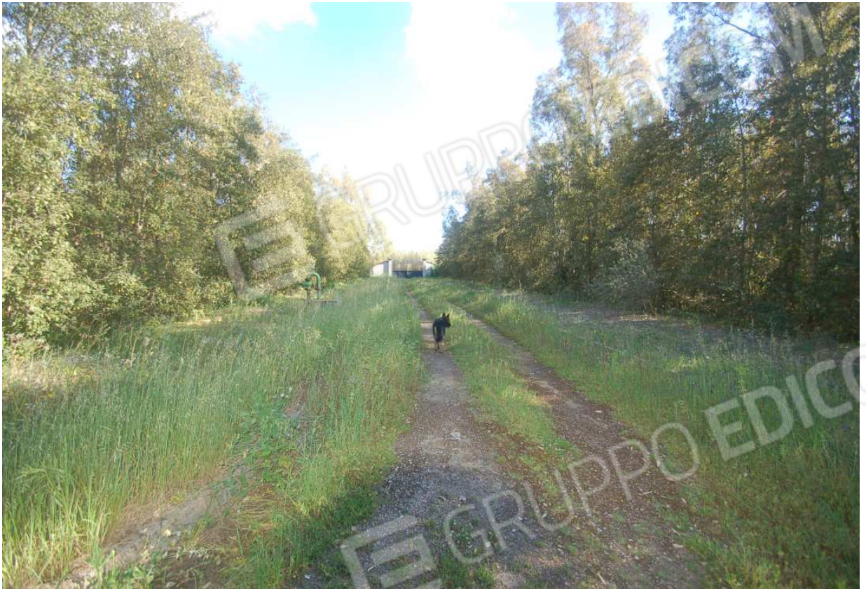
VISTA 54: Mappale 287 - Vista 1