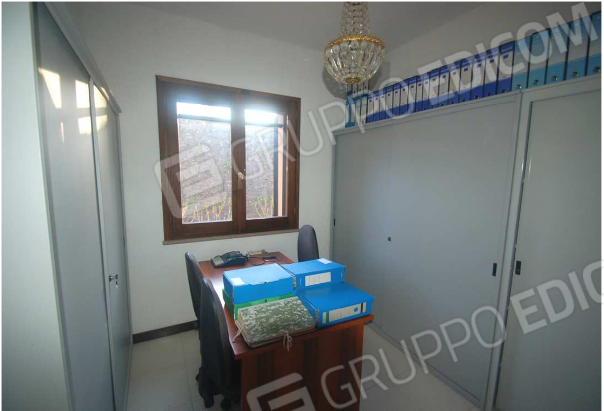
VISTA 21: Piano Scantinato – Archivio - Vista 3