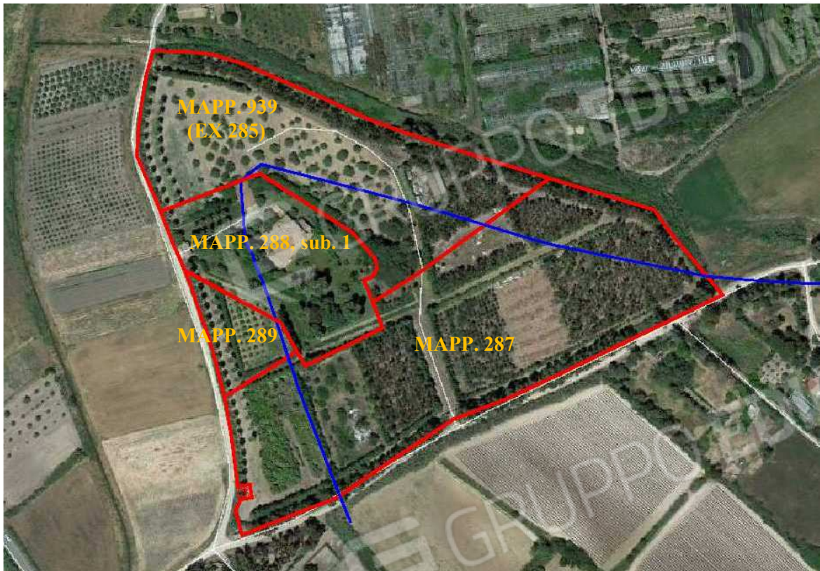
VISTA 3: Individuazione dei mappali - Loc. Su Mattoni snc (vista aerea)