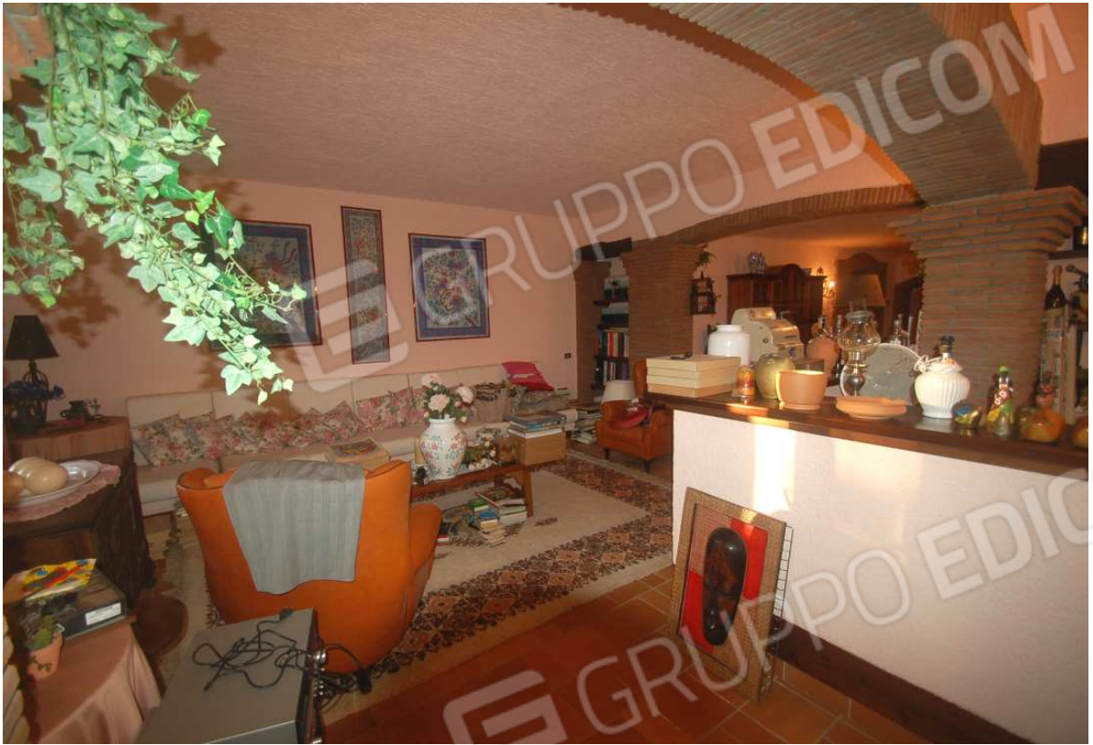
VISTA 25: Piano Scantinato – Soggiorno/Cantina