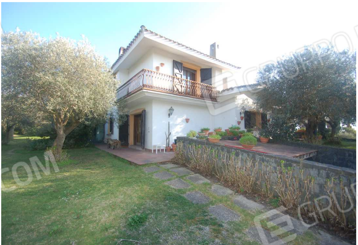
VISTA 8: Scorcio abitazione - Lato Nord