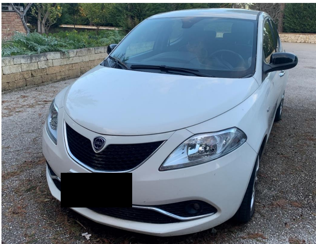
Fotografia n. 19: Autovettura Lancia Ypsilon 3 a serie 1.3 MJT 95CV vista frontale

Studio Tecnico MARZANO Architettura e Ingegneria Via Carlo Ciampitti 38 - Foggia