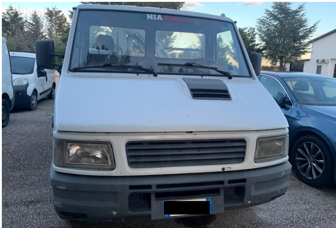
Fotografia n. 22: Autovettura Iveco Daily 35.12 vista frontale