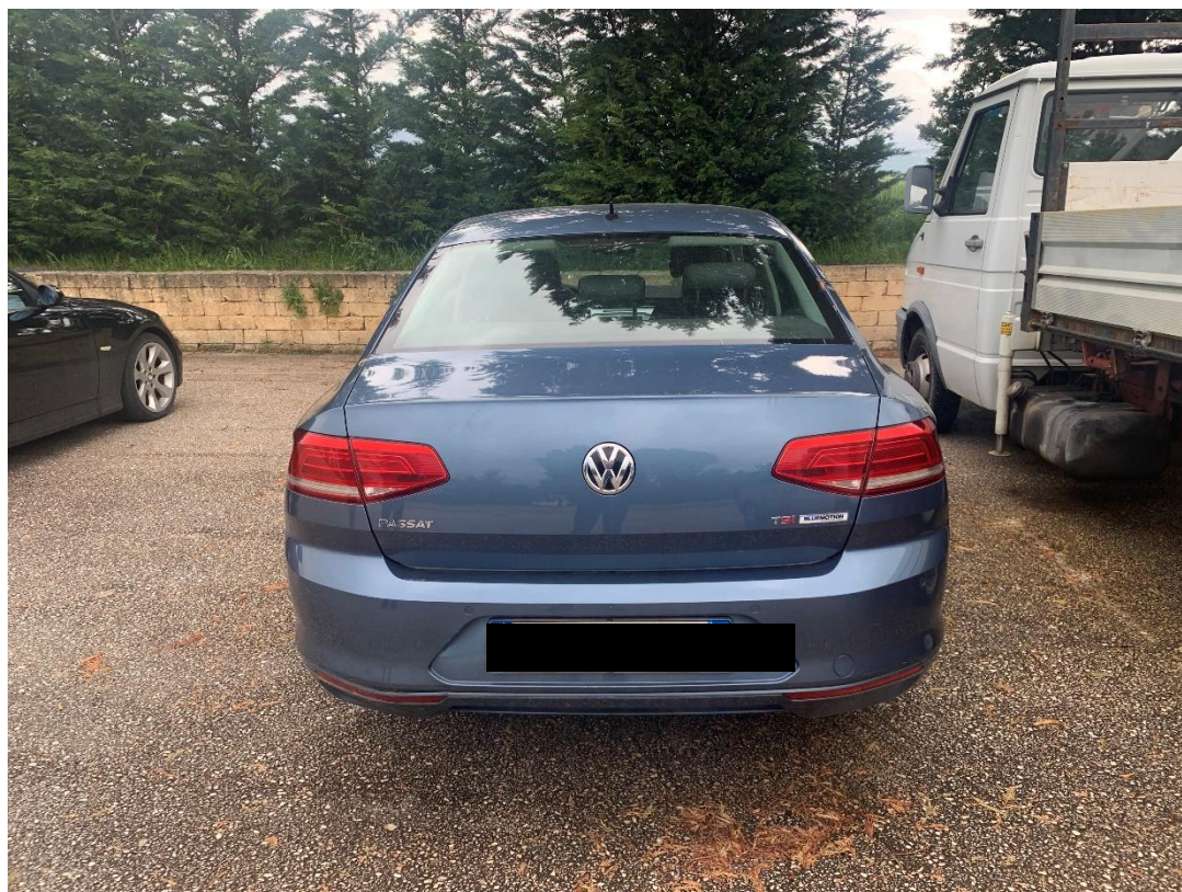
Fotografia n. 30: Autovettura Mercedes Classe CLS 3.0 224CV vista retro

Studio Tecnico MARZANO Architettura e Ingegneria Via Carlo Ciampitti 38 - Foggia