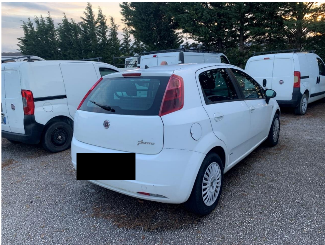
Fotografia n. 14: Autovettura Fiat grande Punto 1.3 MJT 75CV vista retro