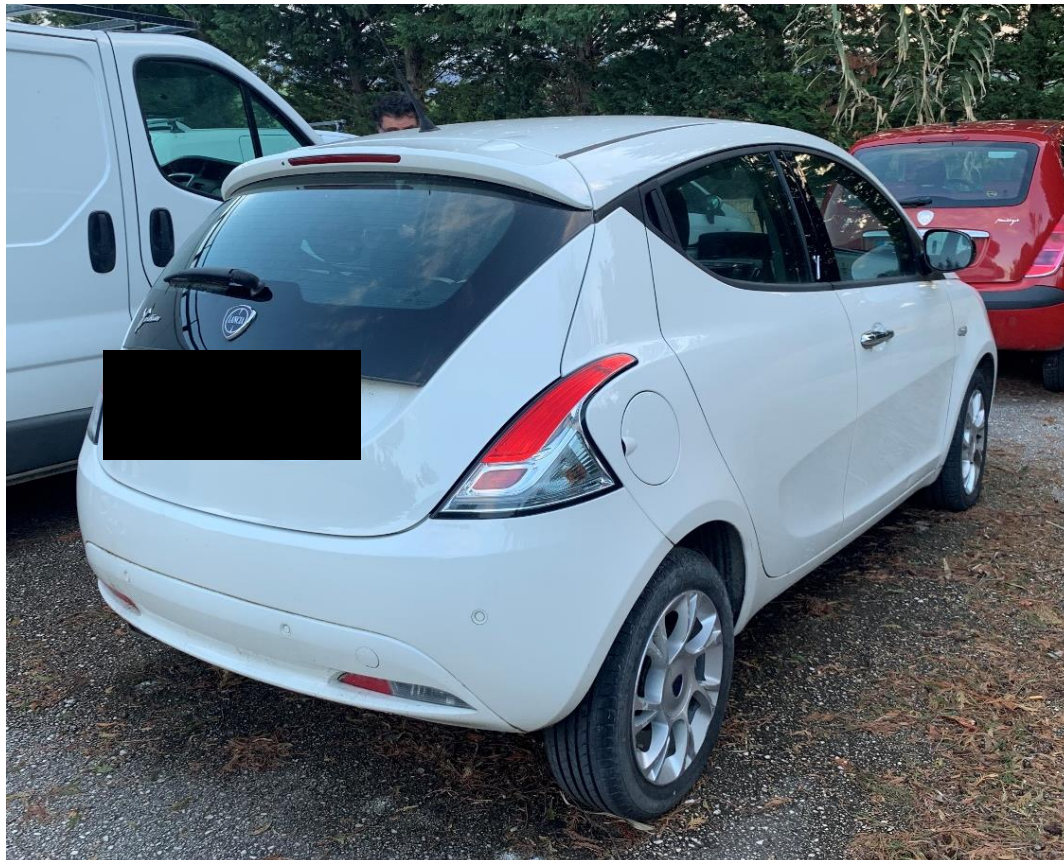
Fotografia n. 21: Autovettura Lancia Ypsilon 3 a serie 1.3 MJT 95CV vista retro