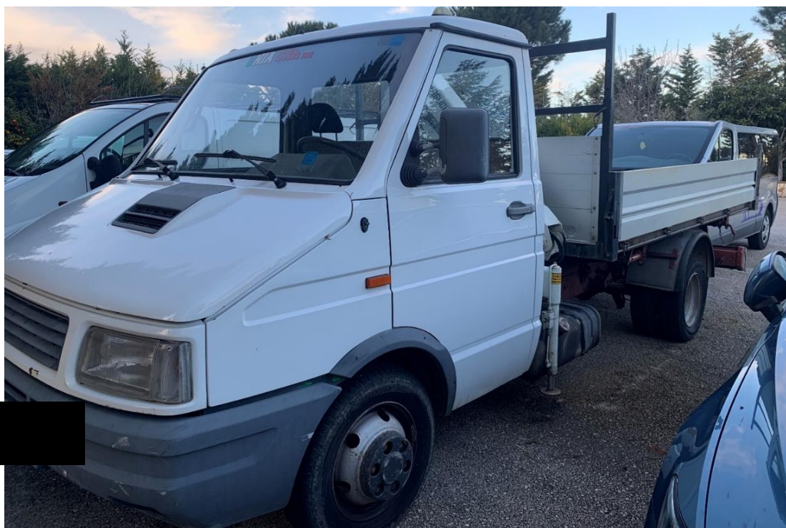
Fotografia n. 23: Autovettura Iveco Daily 35.12 vista laterale