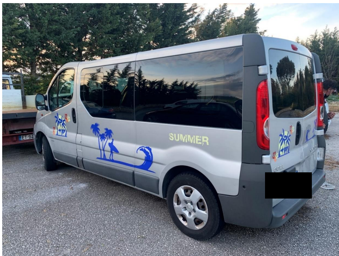
Fotografia n. 33: Autovettura Opel Vivaro 2 a serie PL-TN 2.0 diesel 120CV vista laterale