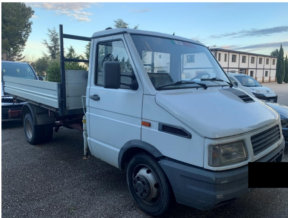
Fotografia n. 24: Autovettura Iveco Daily 35.12 vista laterale

Studio Tecnico MARZANO Architettura e Ingegneria Via Carlo Ciampitti 38 - Foggia