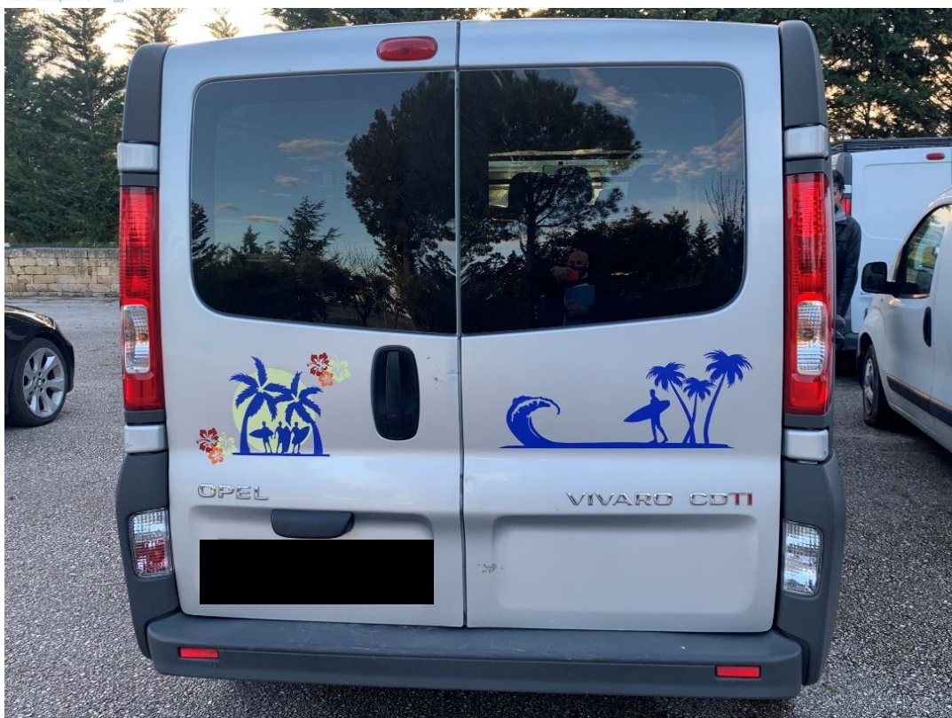
Fotografia n. 32: Autovettura Opel Vivaro 2 a serie PL-TN 2.0 diesel 120CV vista retro

Studio Tecnico MARZANO Architettura e Ingegneria Via Carlo Ciampitti 38 - Foggia