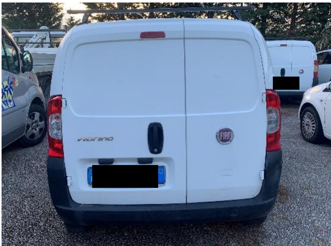
Fotografia n. 1: Autovettura Fiat Fiorino 2 a serie 1.3 MJT 75CV vista retro