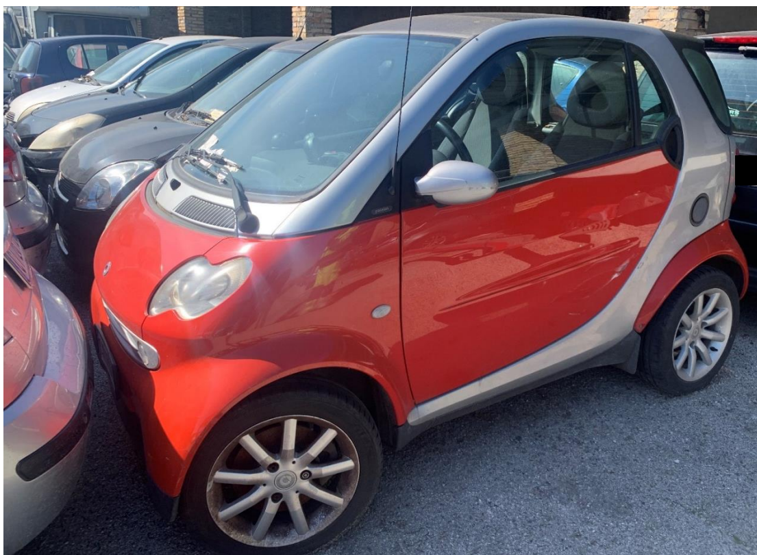
Fotografia n. 34: Autovettura smart fortwo 1 a serie 0.8 40CV 2004 vista laterale

Note peritali: il veicolo si trova in custodia presso il deposito dell'autorità giudiziaria da circa 18 mesi accumulando quindi un importo debitorio dovuto al tempo di custodia quantizzabile in circa euro 4.000,00.