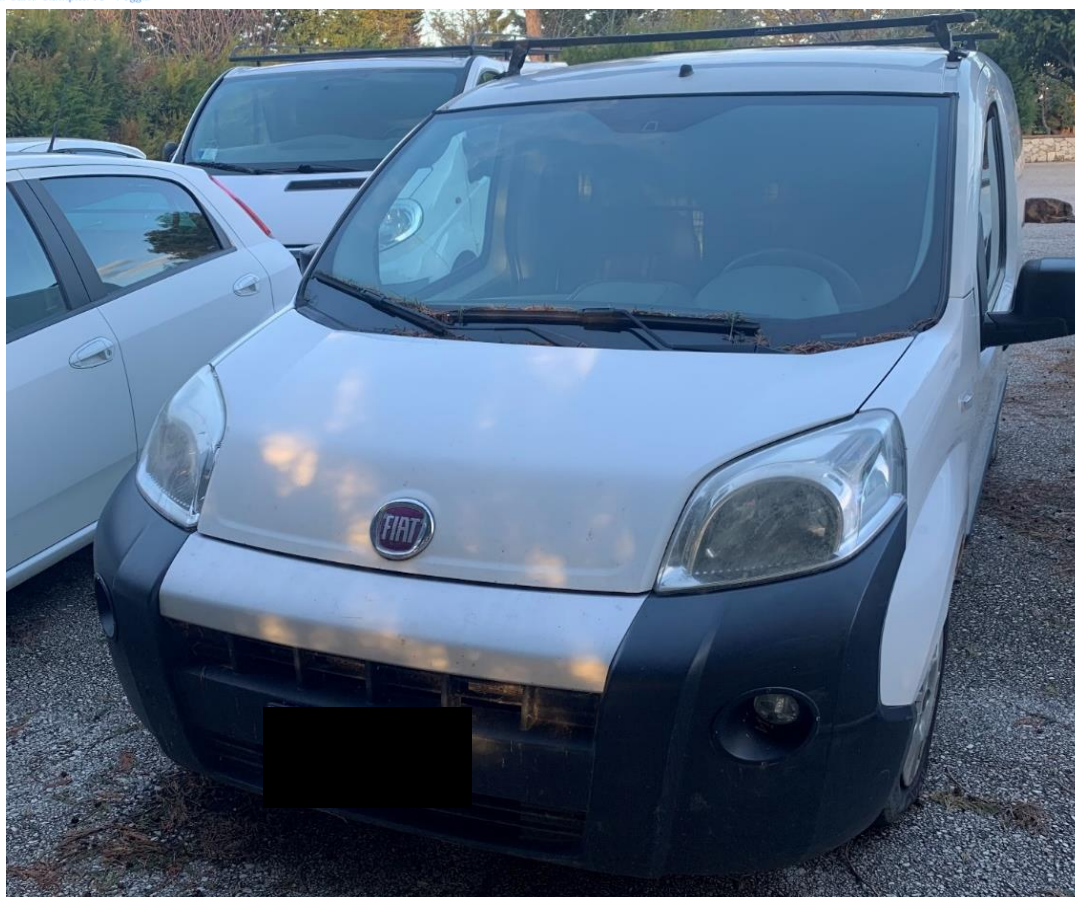
Fotografia n. 7: Autovettura Fiat Fiorino 2 a serie 1.3 MJT 75CV vista frontale