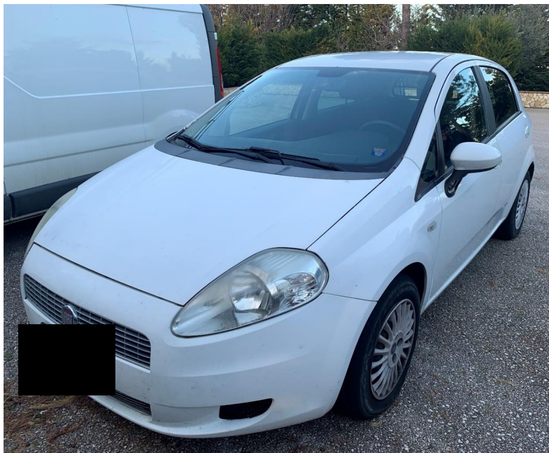
Fotografia n. 15: Autovettura Fiat grande Punto 1.3 MJT 75CV vista laterale

Studio Tecnico MARZANO Architettura e Ingegneria Via Carlo Ciampitti 38 - Foggia