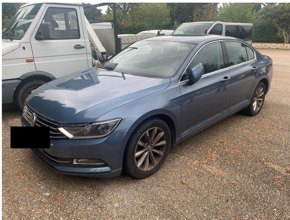
Fotografia n. 29: Autovettura Mercedes Classe CLS 3.0 224CV vista laterale