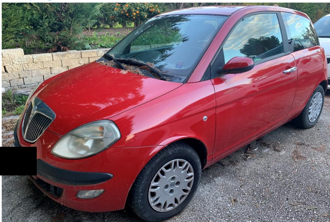
Fotografia n. 16: Autovettura Lancia Ypsilon 1.3 MJT 69CV vista laterale