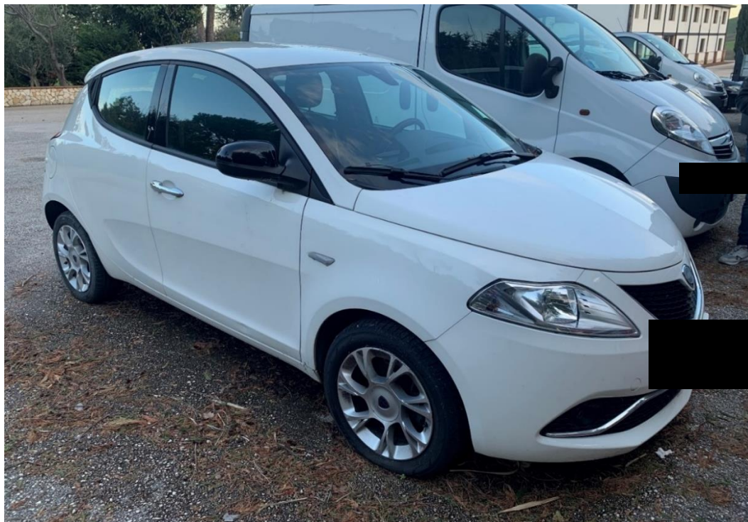
Fotografia n. 20: Autovettura Lancia Ypsilon 3 a serie 1.3 MJT 95CV vista laterale