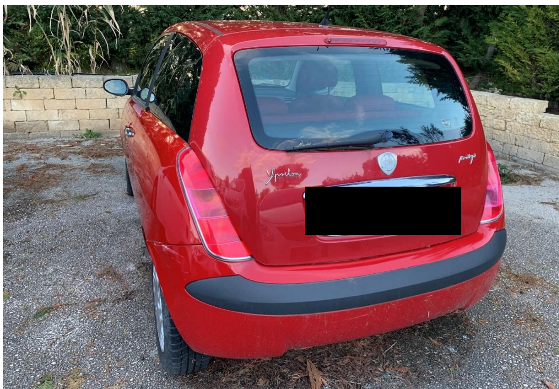
Fotografia n. 17: Autovettura Lancia Ypsilon 1.3 MJT 69CV vista retro