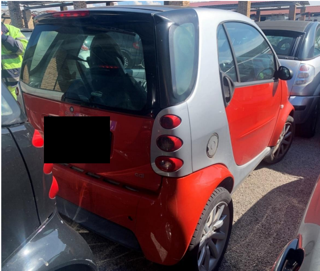
Fotografia n. 35: Autovettura smart fortwo 1 a serie 0.8 40CV 2004 vista retro