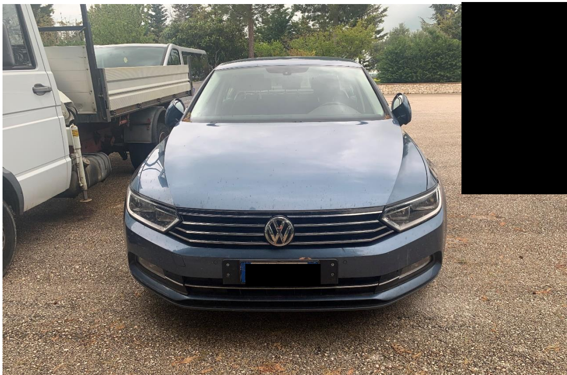
Fotografia n. 28: Autovettura Mercedes Classe CLS 3.0 224CV vista frontale