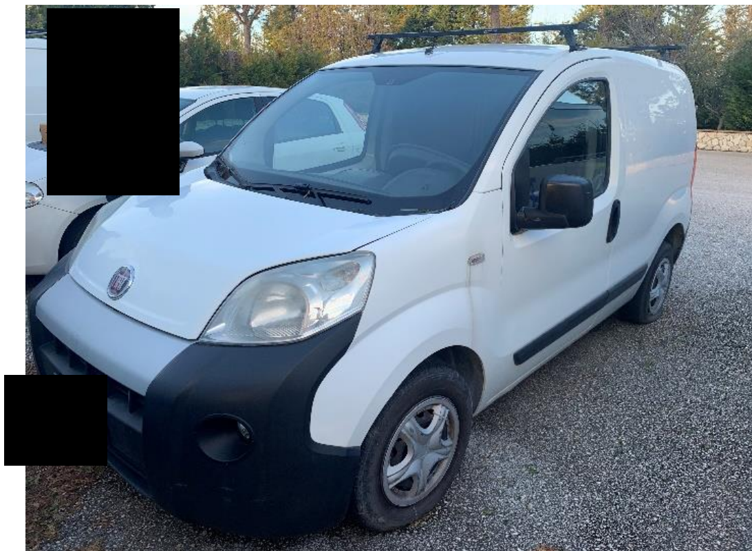
Fotografia n. 2: Autovettura Fiat Fiorino 2 a serie 1.3 MJT 75CV vista laterale