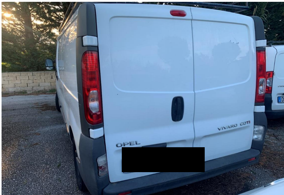
Fotografia n. 5: Autovettura Opel Vivaro 2.0 114CV vista retro

Studio Tecnico MARZANO Architettura e Ingegneria Via Carlo Ciampitti 38 - Foggia