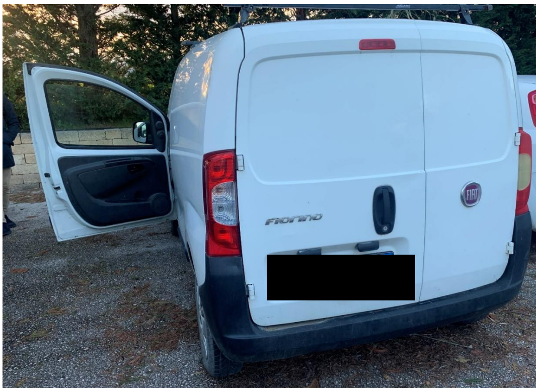
Fotografia n. 9: Autovettura Fiat Fiorino 2 a serie 1.3 MJT 75CV vista retro