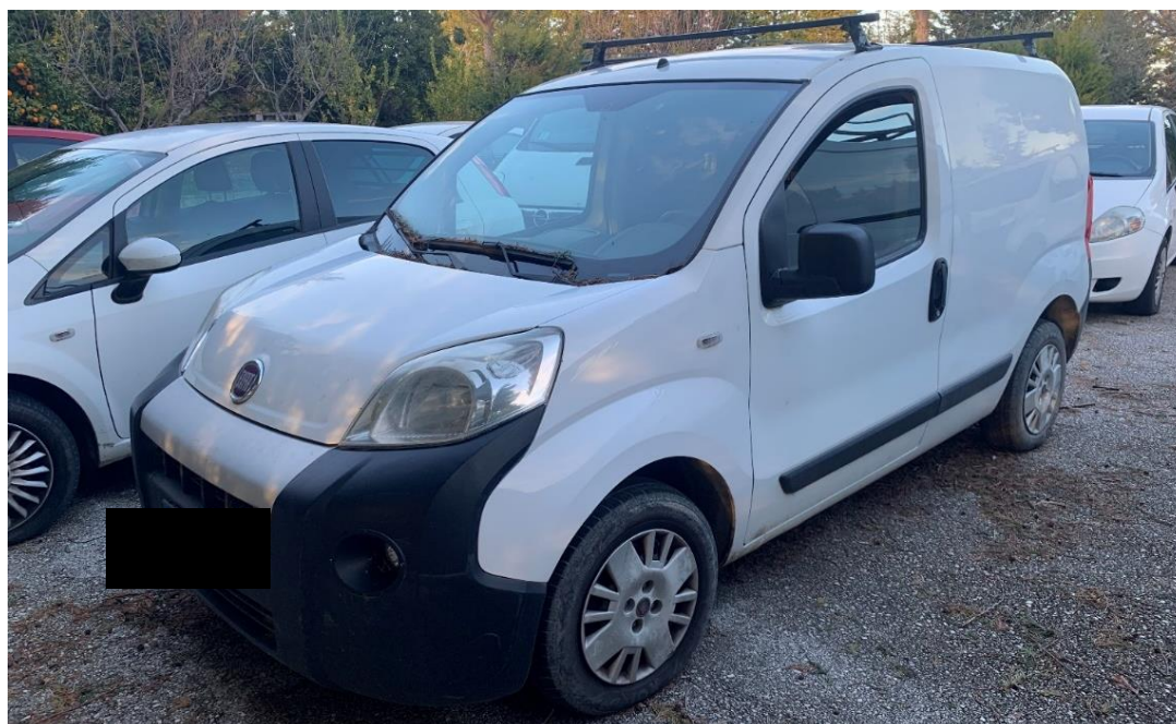
Fotografia n. 8: Autovettura Fiat Fiorino 2 a serie 1.3 MJT 75CV vista laterale