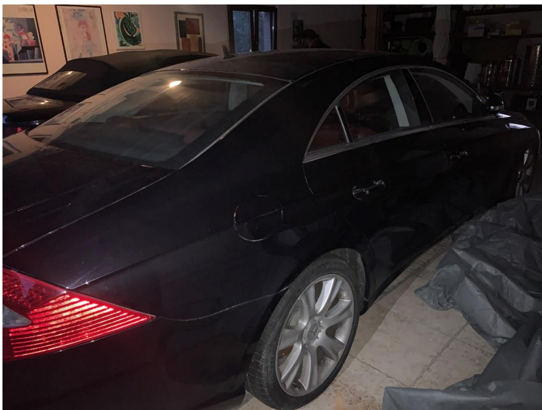
Fotografia n. 27: Autovettura Mercedes Classe CLS 3.0 224CV vista laterale

Studio Tecnico MARZANO Architettura e Ingegneria Via Carlo Ciampitti 38 - Foggia