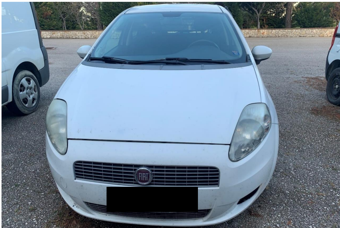
Fotografia n. 13: Autovettura Fiat grande Punto 1.3 MJT 75CV vista frontale