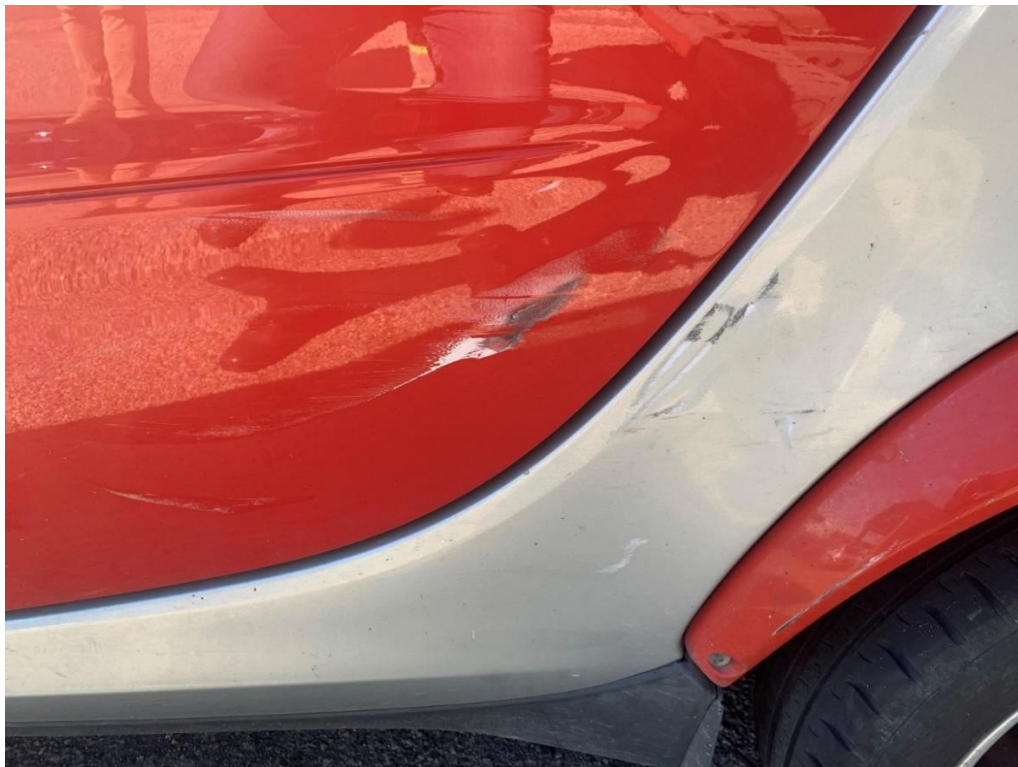
Fotografia n. 36: Dettaglio autovettura smart fortwo 1 a serie 0.8 40CV 2004