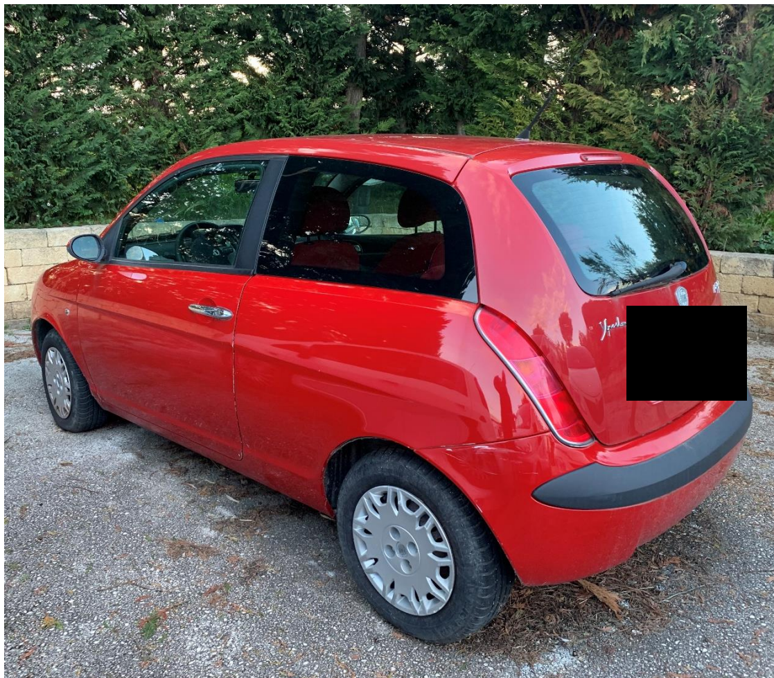
Fotografia n. 18: Autovettura Lancia Ypsilon 1.3 MJT 69CV vista laterale

Studio Tecnico MARZANO Architettura e Ingegneria Via Carlo Ciampitti 38 - Foggia