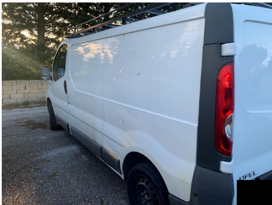
Fotografia n. 6: Autovettura Opel Vivaro 2.0 114CV vista laterale