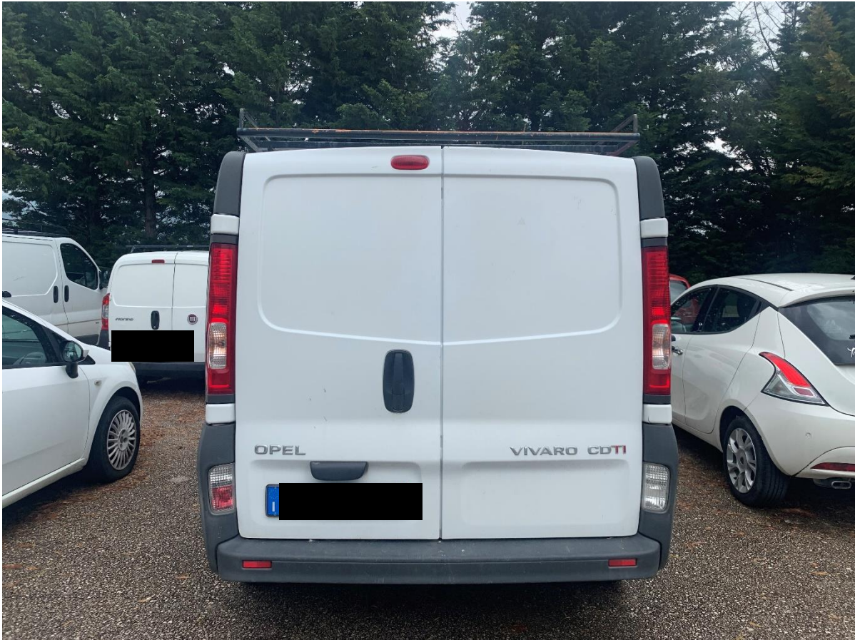
Fotografia n. 12: Autovettura Fiat Fiorino 2 a serie 1.3 MJT 75CV vista retro