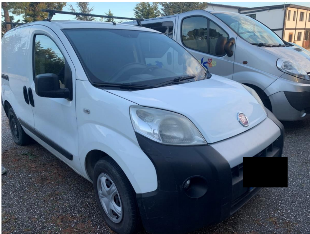
Fotografia n. 3: Autovettura Fiat Fiorino 2 a serie 1.3 MJT 75CV vista laterale

Studio Tecnico MARZANO Architettura e Ingegneria Via Carlo Ciampitti 38 - Foggia