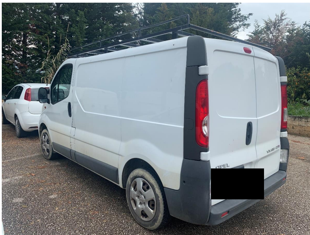
Fotografia n. 11: Autovettura Fiat Fiorino 2 a serie 1.3 MJT 75CV vista laterale