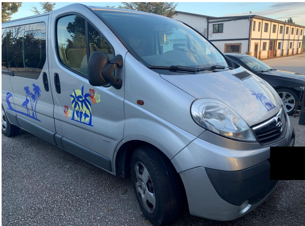
Fotografia n. 31: Autovettura Opel Vivaro 2 a serie PL-TN 2.0 diesel 120CV vista laterale

Studio Tecnico MARZANO Architettura e Ingegneria Via Carlo Ciampitti 38 - Foggia