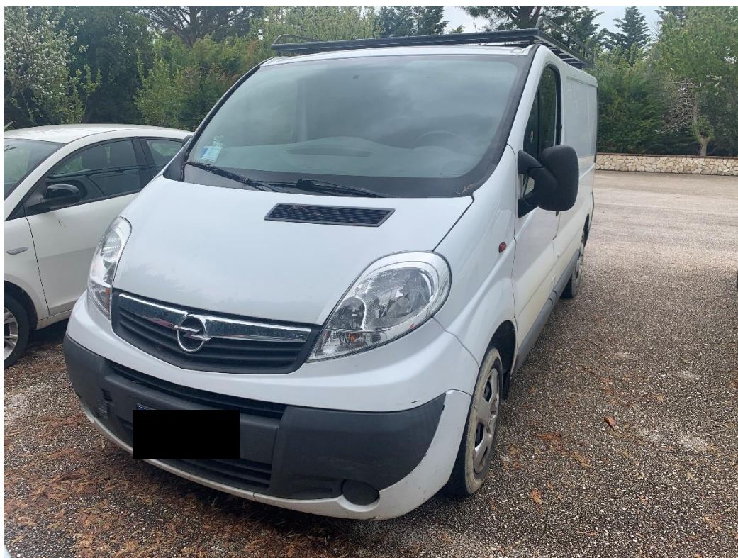
Fotografia n. 10: Autovettura Fiat Fiorino 2 a serie 1.3 MJT 75CV vista frontale