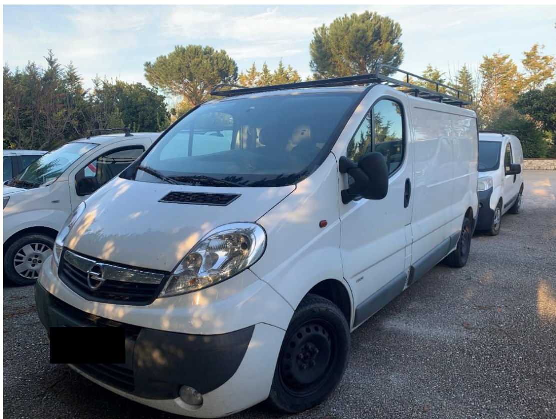
Fotografia n. 4: Autovettura Opel Vivaro 2.0 114CV vista laterale

Studio Tecnico MARZANO Architettura e Ingegneria Via Carlo Ciampitti 38 - Foggia